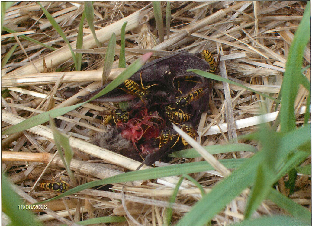
Abb. 2. Von Wespen bereits 2 Std. nach Sonnenaufgang stark angegriffene Rauhhautfledermaus ( Pipistrellus nathusii ) im Windpark Wernitz, Havelland.