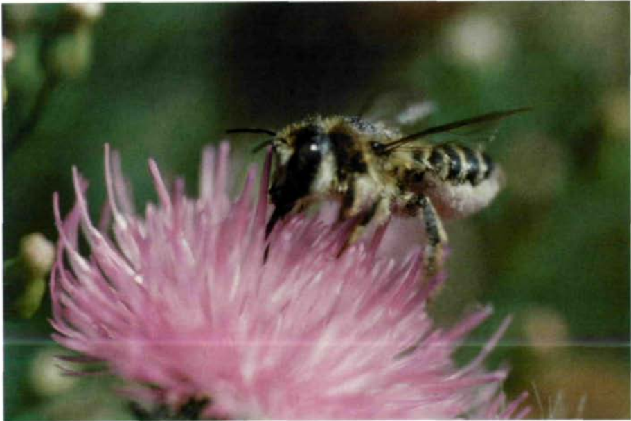
Abb. 2: Lithurgus cornutus auf ihrer bevorzugten Pollenfutterpflanze Carduus acanthoides .