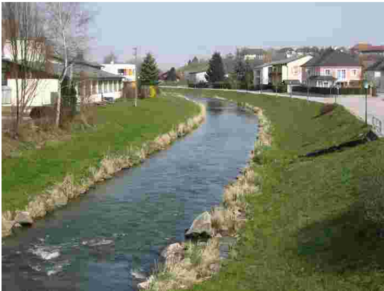
Foto 33005: Verbauter Abschnitt der Krems (flussabwärts) in Wartberg