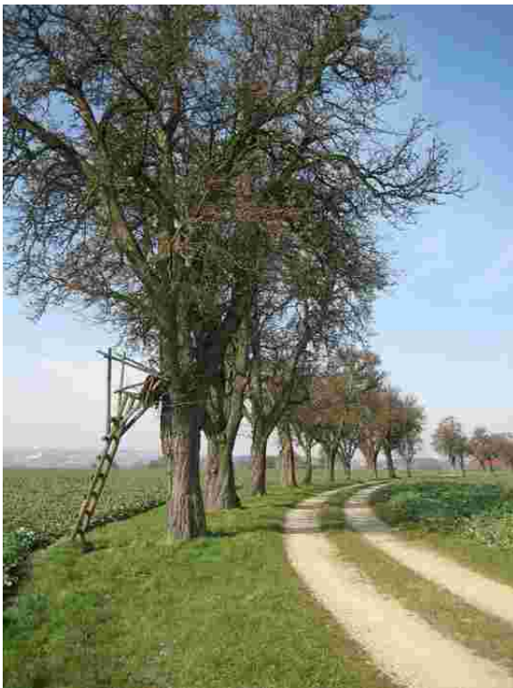
Foto 33007: Obstbaumreihe entlang eines Feldweges westlich von Neukematen