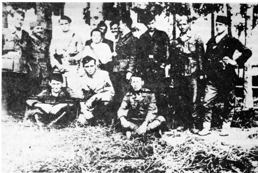
Starešine 4. bataljona posle oslobođenja Bugojna avgusta 1943. sa komandantom brigade Vladom Bajićem (snimak iz foto arhive Vojnog muzeja u Beogradu)

»Štab 3. krajiške brigade, koji je svestrano pripremio svoje jedinice, umješno i pribrano rukovodio njima i uspješno priveo kraju ovu operaciju.