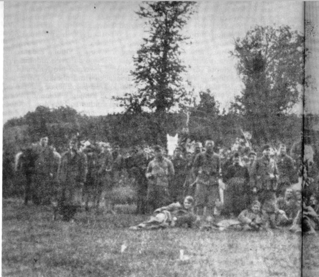
Borci 3. krajiške brigade pred napad na garnizon Bugojno, avgust 1943.

domobrana, nešto milicije, jedan oklopni automobil, 1 top 37 mm, 1 teški minobacač, 3 teška mitraljeza, veći broj puškomitraljeza i drugog automatskog oružja.