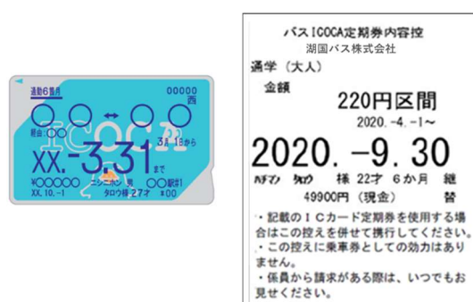
<バス ICOCA 定期券内容控>