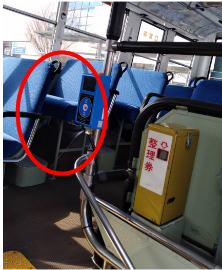
〈乗車時のICカードリーダー〉