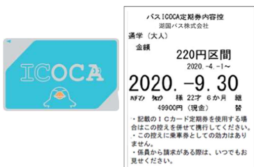
<バス ICOCA 定期券内容控>