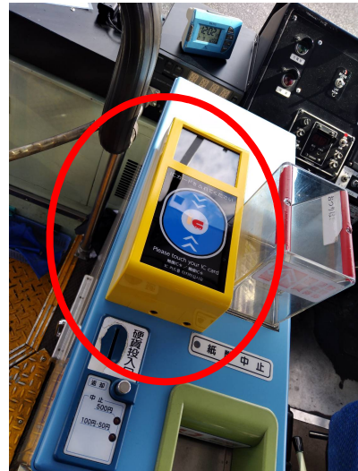
〈降車時のICカードリーダー〉