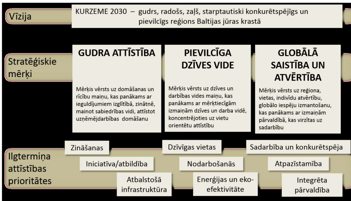
2. attēls. KPR Ilgtspējīgas attīstības stratēģijas 2015.-2030.gadam vīzijas, stratēģiskie mērķi un ilgtermiņa attīstības prioritātes.

KPR Ilgtspējīgas attīstības stratēģija 2015.-2030.gadam vīzijas, stratēģiskie mērķi un ilgtermiņa attīstības prioritātes parādītas 2. attēlā.