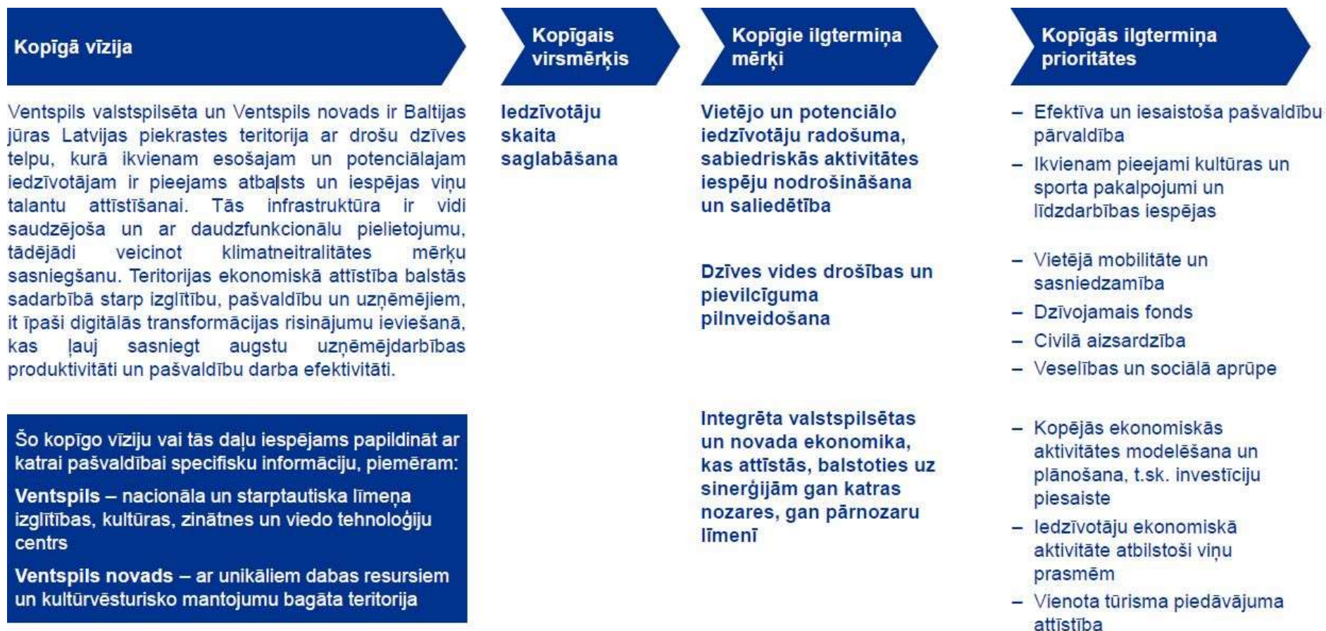
6. attēls. Stratēģijas 2030 izstrādes gaitā izvērtētais attīstības Variants 1: Stratēģijā 2030 neiekļauts.