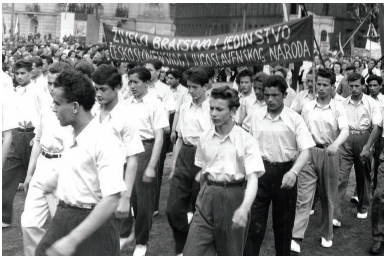
Jugoslávští učni v prvomájovém průvodu v Ústí nad Labem, ještě před rezolucí Informbyra