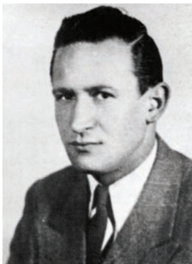
Antun Novak, šifrant jugoslávského velvyslanectví, defektor, člen jugoslávské politické emigrace a posléze i agent Státní bezpečnosti