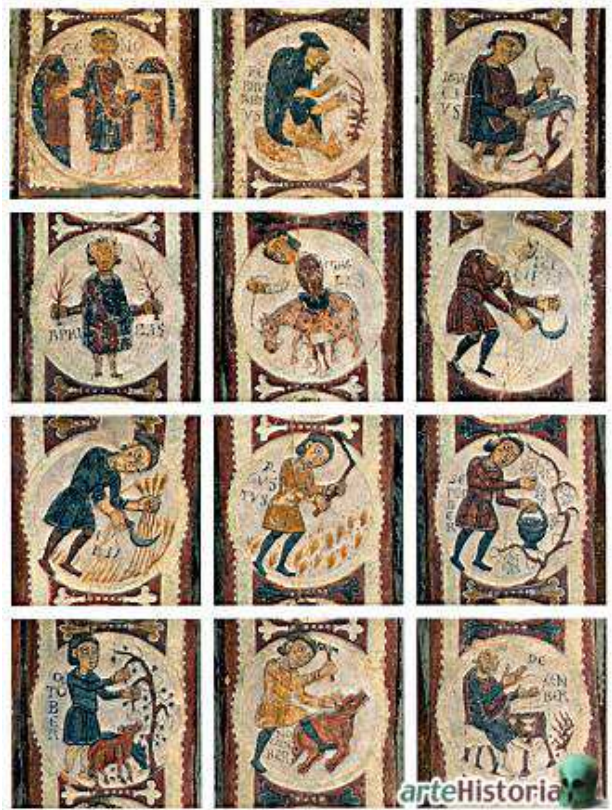
Panteón Real de San Isidoro de León (España), intradós de uno de los arcos (ca. 1100). Medallones con el calendario agrícola.

http://commons.wikimedia.org/wiki/File:Wien_%C3%96NB,_Cod._387,_90v.jpg [captura 31/05/2009]