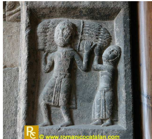
Monasterio de Santa María de Ripoll, Gerona, cara interna de las jambas de la portada occidental (mediados del s. XII). Mes de julio.

http://www.art-roman.net/brinay/brinay14x.jpg [captura 31/05/2009]