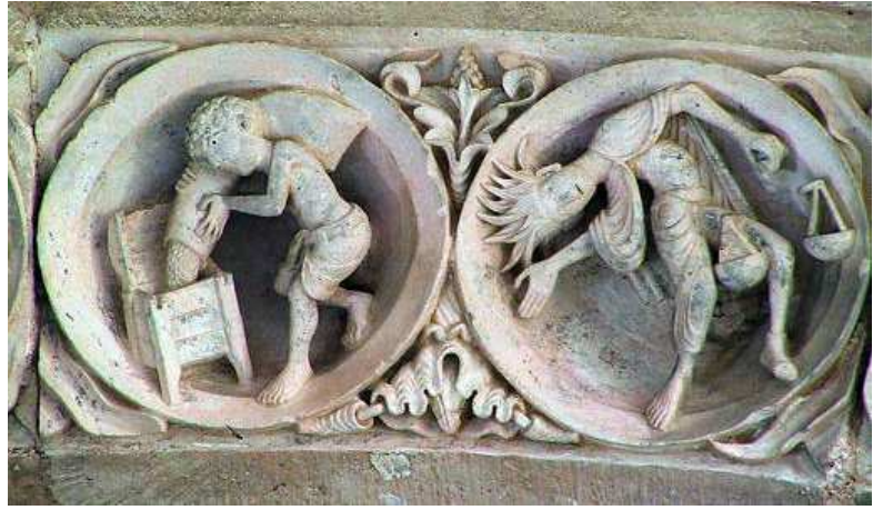
Iglesia abacial de la Magdalena de Vézelay (Francia), arquivolta del vano central de la portada occidental (primeras décadas del siglo XII). Mes de septiembre junto al signo de Libra.

http://www.franceonyourown.com/TournusStPhilibertMosaic_sm.jpg [captura 31/05/2009]