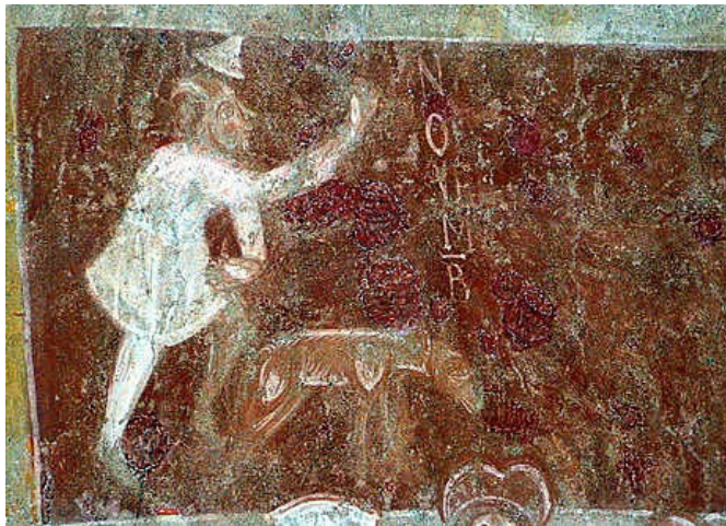
Parroquial de Saint-Aignan, Brinay-sur-Cher (Francia), intradós de arco (ca. 1140). Mes de noviembre.