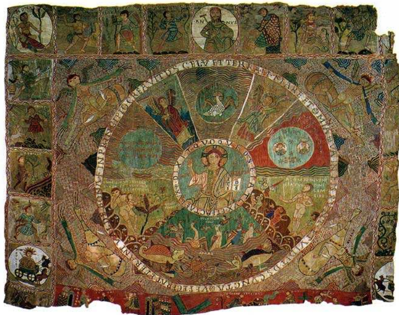
Tapiz de la Creación (ca. 1100), catedral de Gerona (España). Calendario junto a estaciones del año.

http://wa5.www.artehistoria.jcyl.es/tesoros/jpg/AUI20223.jpg [captura 31/05/2009]