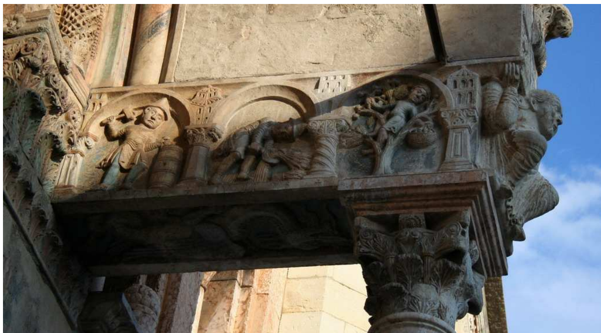
▲ San Zeno Maggiore de Verona (Italia), relieves del arquitrabe del prótiro (ca. 1138). Meses de junio, julio y agosto.

http://medieoivo.org/artemedievale/Images/EmiliaRomagna/Modena/Modena63.jpg [captura 31/05/2009]