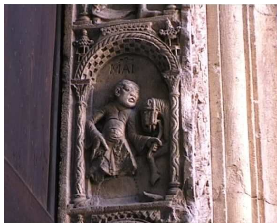
Porta della Pescheria, catedral de Módena (Italia), fines del s. XI-inicios del s. XII. Mes de mayo.

http://medieoivo.org/artemedievale/Images/EmiliaRomagna/Modena/Modena63.jpg [captura 31/05/2009]