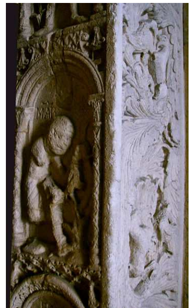
Porta della Pescheria, catedral de Módena (Italia), fines del s. XI- inicios del s. XII. Mes de marzo.

http://www.xtec.cat/~fchorda/ee6/18/index.htm [captura 31/05/2009]