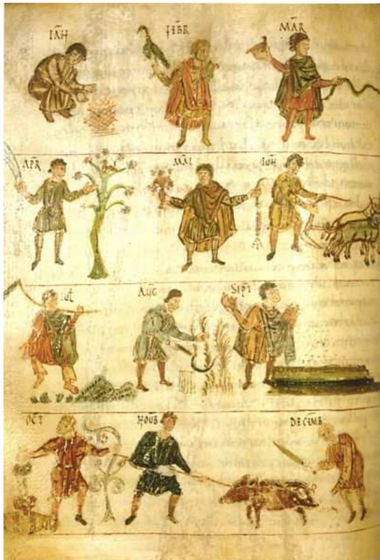
Aratea carolingia (830). Viena, Österreichische Nationalbibliothek, 387, fol. 90v. Figuración de los meses del año.

http://commons.wikimedia.org/wiki/File:Wien_%C3%96NB,_Cod._387,_90v.jpg [captura 31/05/2009]