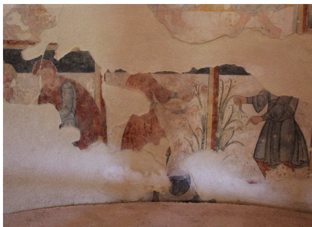
San Pelayo de Perazancas, Palencia (España), frescos del zócalo del hemiciclo (ca. 1100). Restos de un calendario agrícola.