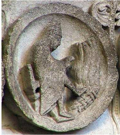
Saint-Lazare d'Autun, arquivolta de la portada occidental (primeras décadas del s. XII). Mes de enero.

http://www.franceonyourown.com/TournusStPhilibertMosaic_sm.jpg [captura 31/05/2009]