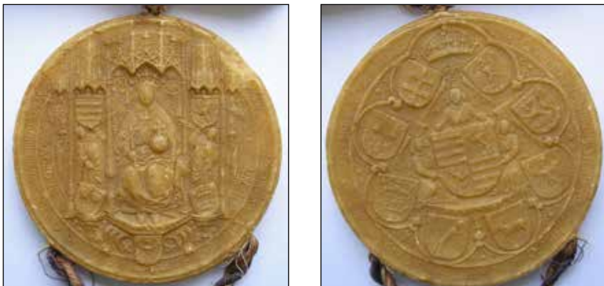
Č. 10 Vladislav II., uhorský kráľ, 1501 – averz Č. 11 Vladislav II., uhorský kráľ, 1501 – reverz