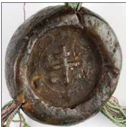
Č. 20 Hodnoverné miesto Turčiansky konvent, 1365