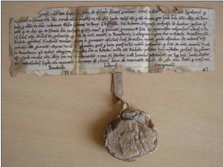
Č. 1: Tomáš, ostrihomský prepoš, 1228