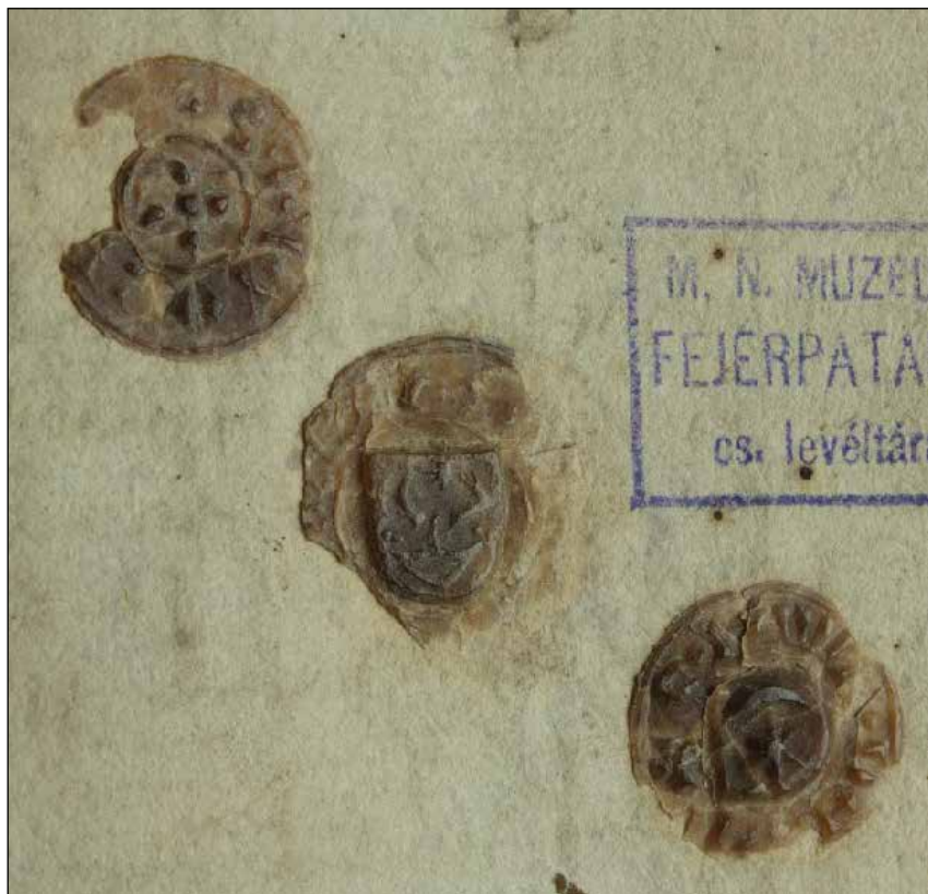
Č. 53 Liptovská župa, 1447

diversis inconvenientiis, que hactenus sepe numero in comitatibus contigerunt, propter incerta et ignota sigilla, in posterum in singulis comitatibus sub uno sigillo litere nomine comitatus expediende, ex benigna concessione regie maiestatis, expediantur, quemadmodum fit in comitatu Symigiensi; que quidem sigilla postquam fuerint impetrata et comperta, asserventur in singulis comitatibus in archa seu ladula sub sigillo vicecomitum, iudicum et iuratorum nobilium, neque excipiantur, nisi cum tempore sedis iudicarie litere aliquae nove comitatus fuerint obsignande, quibus etiam literis subscribant se idem vicecomites, iudex et iurati nobiles vel ex eis qui sciunt scribere, simul etiam notarius comitatus).