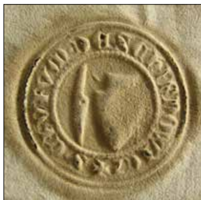
Č. 49 Bardejov, 1447