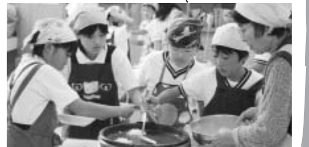
オランダ料理に取り組む津和野小児童

津和野小学校の料理クラブで10月21日オランダ料理教室が開かれ、子どもたちはオランダの代表的な家庭料理のひとつ「パネケーキ」づくり挑戦しました。 この企画は、本町出身の啓蒙思想家西周がオランダのライデン大学で学び、江戸末期から明治初期の日本の発展に大きく寄与したことから、町が岡山県津山市とともにライデン市に記念プレートを設置し交流を行っていることを受けて、同クラブを指導していただける三つ葉会の皆さんが計画されたものです。 子どもたちは、チーズやバナナの入った3種類のパネケーキを三つ葉会の皆さんといっしょに作り上げると、おいしそうに頬張りながら津和野の先哲西周とオランダについて役場職員から説明を受け、オランダへ思いを馳せていました。