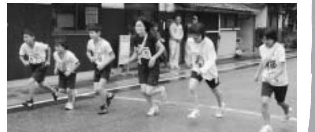
一斉にスタートする選手の皆さん

10月22日、津和野駅伝競走大会が長野から津和野庁舎前の6区間で争われ、19チームが一般、職域、女子、小学生、オープンの部に分かれてそれぞれ秋の津和野路を駆け抜けました。 時折雨模様であったこの日ですが、イシヨシとなったこの日ですが、選手の方々は沿道の温かい声援を受けて日頃鍛えた健脚を発揮され、多くの選手が走り終えると倒れ込むほどになりながら、タスキをつないで一路ゴールをめざして力走されました。 競技の結果、一般の部では畑追Aチームが、職域の部では津和野分遣所チームが、女子の部ではラニンングママチームが、小学生の部では津和野陸上教室Aチームがそれぞれ優勝されました。