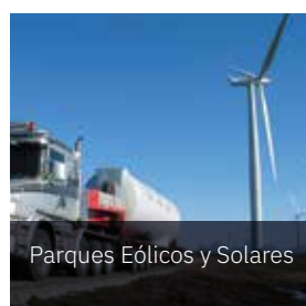
Parques Eólicos y Solares