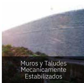
Muros y Taludes Mecánicamente Estabilizados