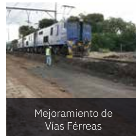
Mejoramiento de Vías Férreas

Escanea este código QR para leer de estos y otros mercados que atendemos.