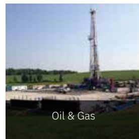
Oil & Gas