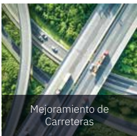
Mejoramiento de Carreteras