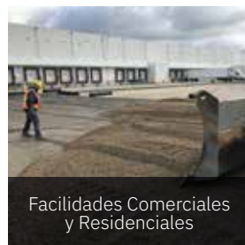
Facilidades Comerciales y Residenciales