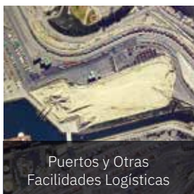
Puertos y Otras Facilidades Logísticas