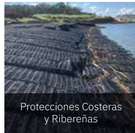
Protecciones Costeras y Ribereñas