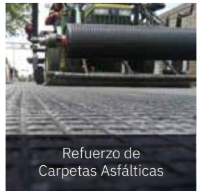
Refuerzo de Carpetas Asfálticas

Reducción Probada de Costos y Tiempos de Construcción en los Sigüientes Segmentos de Mercado: