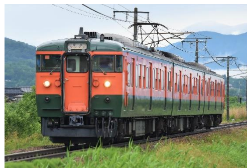
【写真:しなの鉄道・115系電車(S3編成)】

今から47年ほど前に国鉄各線に登場し、約半世紀にわたり現在も地域の足として活躍を続けていますが、特に当社線で走行している耐寒耐雪強化型の車両は、現在国内ではその数を減らしている状況であり、近年は全国からその雄姿を目当てに多くの鉄道ファンが訪れています。