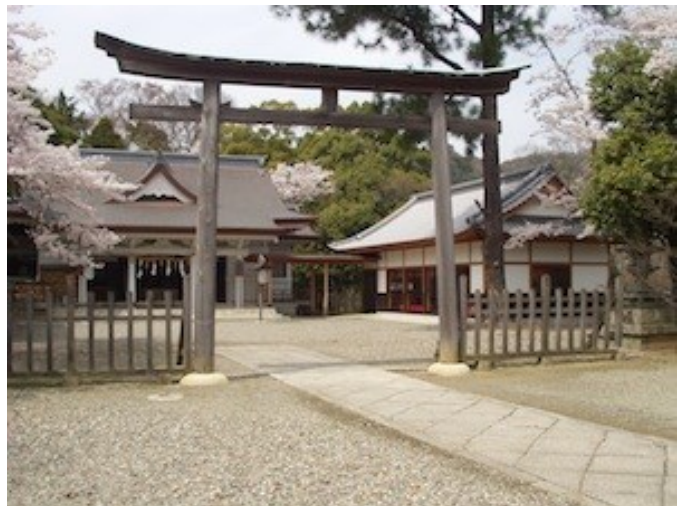
忌部神社

その神座 しんざ に神衣 かむそ として奉る御料は麩服 あたらえ と申し上げる麻の織物です。麩服は現在の徳島県にあたる阿波国の忌部氏が奉織することが決められており、忌部氏人たちが御殿人 みあらかんど となって麩服神服 あたらえかんみそ が調製されます。平成2年(1990)11月に執り行われた踐祚大嘗祭では徳島県で麩服神事 あたらえしんじ が執り行われ、天日鷲命 あめのひわしのみこと をお祀りする忌部神社が中心となって現在に伝わる忌部氏の後裔が御殿人として麻を調えました。『古語拾遺』に記された古伝は今も受け継がれています。