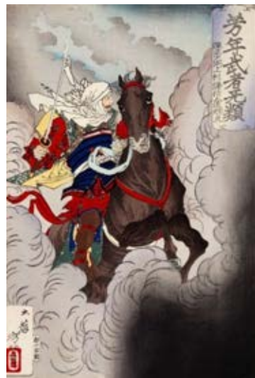
上杉謙信 月岡芳年画

護である上杉氏やその被官の長尾氏がこれらの座を支配し、その収益が後の戦国大名・上杉謙信の活動を支えたとされています。やがて上杉氏は陸奥国会津そして出羽国米沢へ国替えとなりますが、各地でも苧麻の栽培を奨励したとされています。国の重要無形文化財に指定されている越後上布や小千谷縮という伝統的な織物産業はこの系譜に連なっており、その原材料である米沢苧、そして現在は本州で唯一となる高品位な苧麻の生産地である福島県大沼郡昭和村の営みにも続いています。