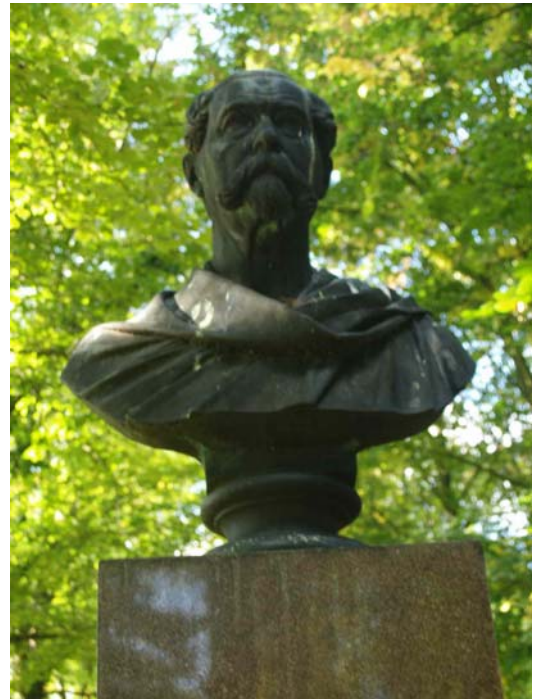
Buste for general Haffner på Egholm.