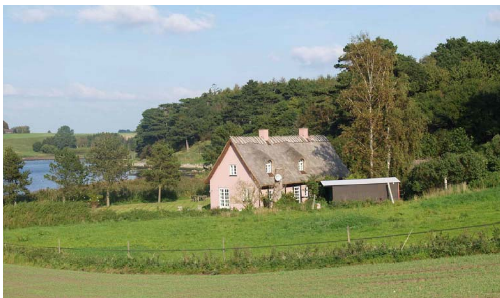
I bunden af Vellerup Vig byggede man i 1885 Egholm anløbsbro. Herfra var der forbindelse med dampskib til Holbæk. Her ligger stadig Brohuset, hvor opsynsmanden for broen boede.