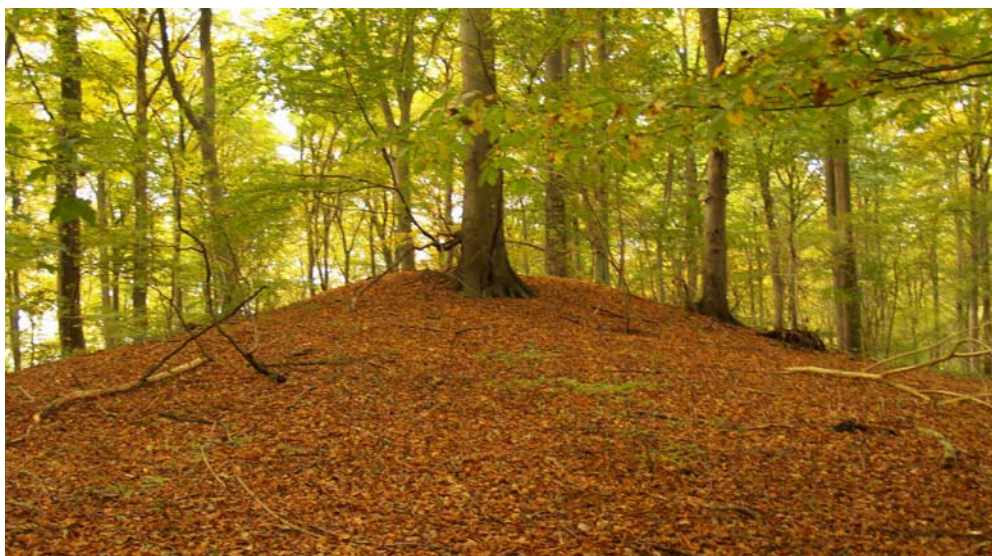
I Egholm skov ligger to bronzealderhøje. Denne hedder Skruthøj. Den ligger op til Vellerupvej.