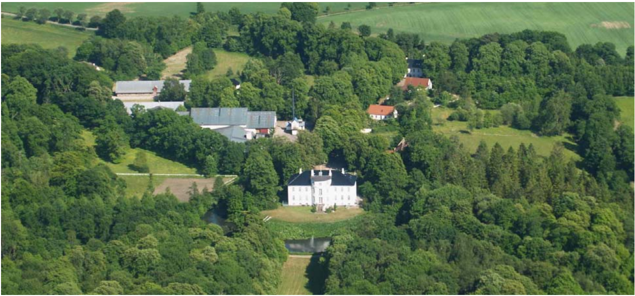
Den gamle avlsgård ligger sydøst for hovedbygningen.