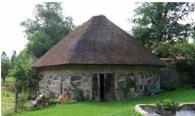
Den gamle fredede kampestens hesteomgang.