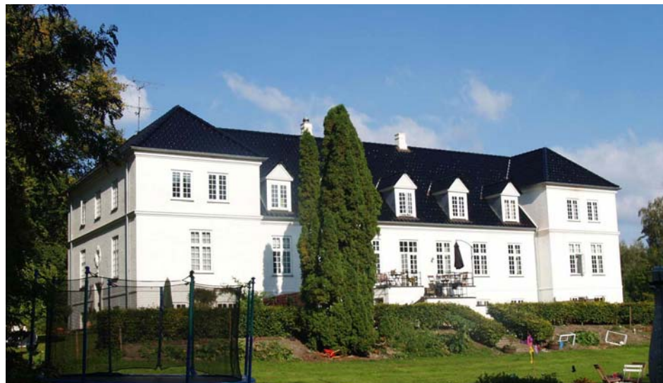
Avlsgårdens hovedbygning fra 1905 er lejet ud.