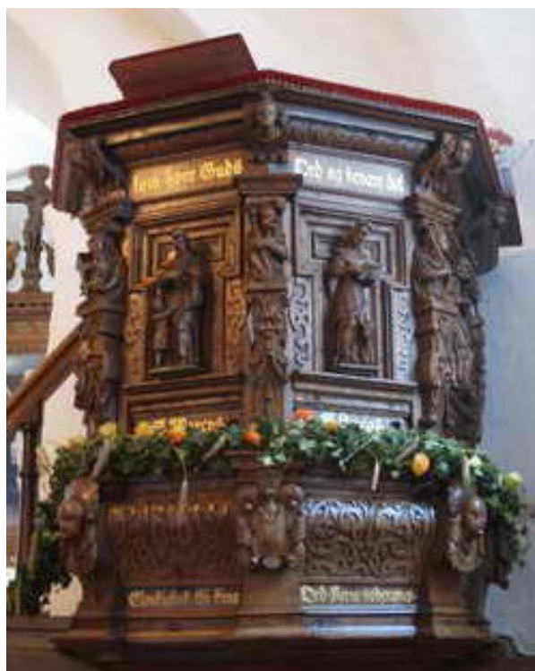
Prædikestol med Krafse's våben