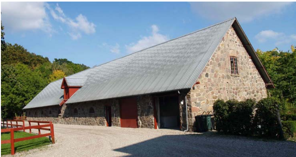
En af de gamle længer bygget af kampesten. Den er lejet ud sammen med mange af gårdens boliger.