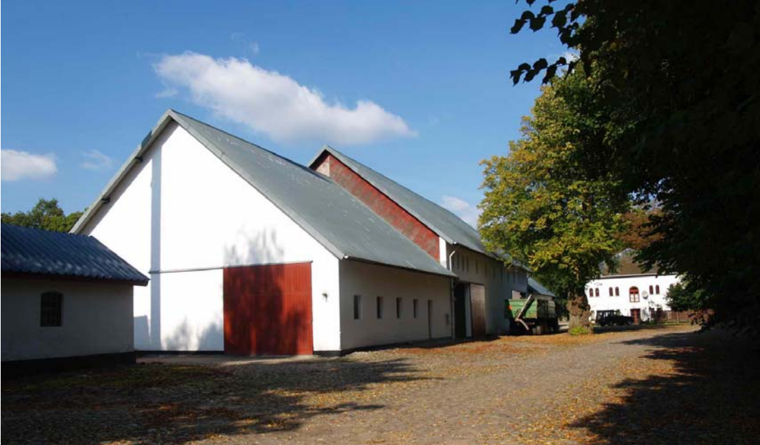
Avlsbygningerne til det nuværende markbrug.