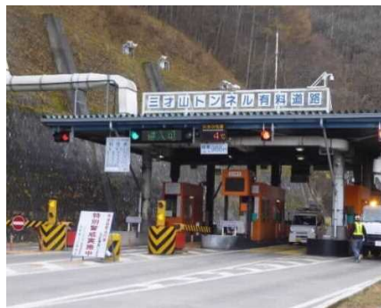
上田側から見る三才山料金所