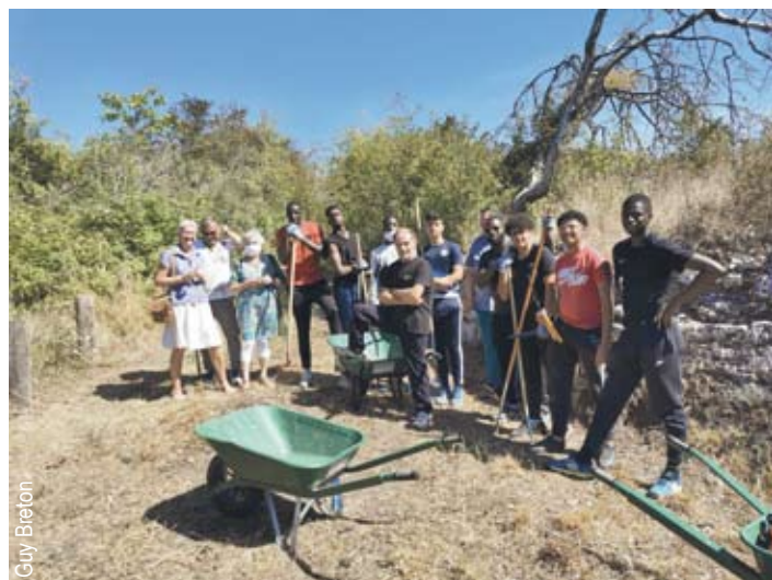
■ L'équipe du « Chantier Jeunes » pose après les travaux effectués sur la butte de Châteauneuf pour aménager le futur sentier des « plantes sauvages des bords des chemins ».