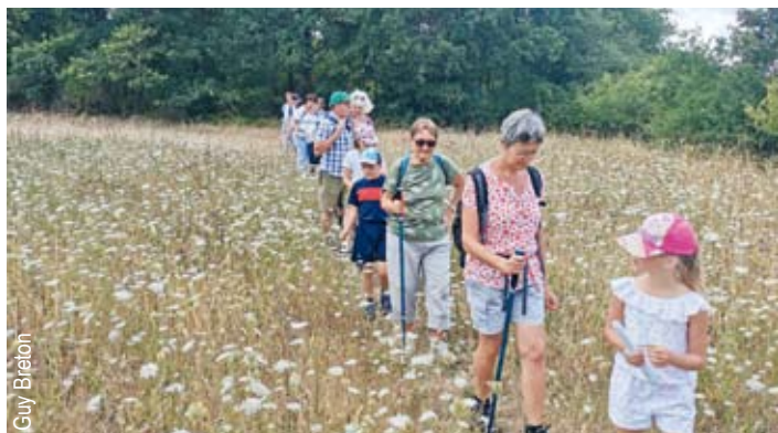
■ Sorties Nature dans la lande de Courcelles et sur le GR2 au-dessus des Andelys.

En septembre, quatre sorties en début de soirée ont été proposées aux adhérents pour écouter le brame du cerf et 32 personnes y ont participé.