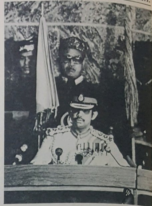
Kebawah DYMM Paduka Seri Baginda Sultan dan Yang Dipertuan Negeri Brunei ketika bertitah di-Istiadat Perasmian Majlis Mashuarat Negeri.

Sa-lain dari itu, Ahli2 Yang Berhormat dalam Majlis ini akan membincangkan beberapa perkara yang penting pada mempuskan lagi hasrat Beta dan Kerajaan Beta dalam perkara2 yang akan mendatangkan kebajikan kepada raayat dan penduduk Negeri ini, antara-nya Majlis ini akan membincangkan beberapa Rang Undang2, sama ada Undang2 yang baru mahu pun Pindaan2 gubahan (pembbaikan2) kepada Undang2 yang lama, yang mana Beta berharap kesemua ini Ahli2 Yang Berhormat da-