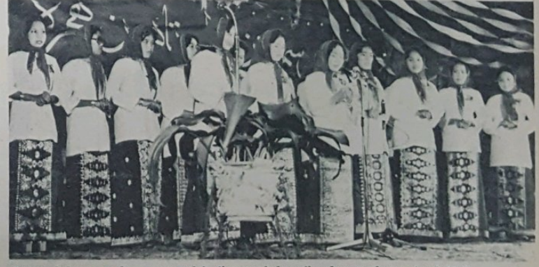
Antara beberapa acara yang telah di-persembahkan di-malam sambutan Awal Muharram, tahun baru Islam 1398 Hijrah bagi Daerah Brunei dan Muara pada malam Ahad, 11hb Disember yang baru lalu, persembahan nashid dari kumpulan wanita Kampong Tamoi telah juga turut menyirikan sambutan tersebut saperti yang kelihatan dalam gambar atas. (Gambar JHEU).

Di-akhir ucapan saya, dan dengan sempena menyambut Peristiwa Hijrah Rasulullah s.a.w. ini saya suka-lah berseru kepada umat Islam di-negeri ini supaya di-tahun baru Hij- rah ini kita sama2 mengin- safi akan keburukan2 yang berlaku dalam masharaka- kat kita supaya di-samping ada-nya keadaan yang bertam- bah baik dalam masharaka- kat kita itu, kita tidak akan mendapati beberapa keja- dian2 yang buruk yang bole- h menyebabkan kerosakan kepada masharaka- kat kita di- masa2 akan datang. Peran- an tuan2 dan puan2 yang di- mainkan untuk merubah keadaan masharaka- kat dari yang buruk kepada yang baik dan dari yang sudah baik kepada yang lebeh baik lagi ada-lah satu sum- bangan besar kepada ne- gara dan agama kita. Mu- dah2an dengan ada-nya ke- insafan dan usaha2 ka-arah kebaikan itu masharaka- ta dan negara kita akan tet- ap di-dalam keadaan aman tenteram, tegoh bersatu, makmur sejahtera, dan mendapat keredhaan Allah Subhanahu Wata'ala jua.