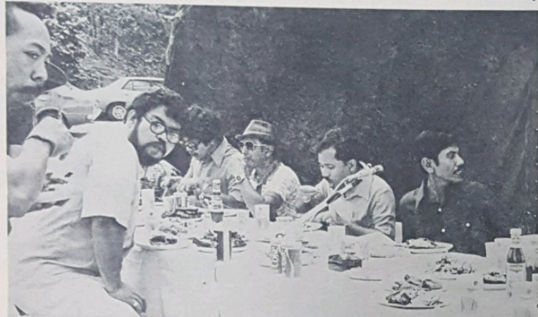
Yang Berhormat Pehin Jawatan Luar Pekerma Raja Dato Setia Awang Haji Hussain (gambar atas) kelihatan sedang menyampaikan cheramah-nya dalam majlis dalog di-Perkelahan Belia di-Pantai Tungku, Gadong, yang baru lalu. Manakala kedua2 gambar bawah memperlihatkan suasana dalam perkelahan tersebut — pangang kambing dan siar satu2-nya hidangan yang membuka selera peserta pada hari itu. Kelihatan dua orang peserta ini sedang menggali lobang untuk tempat membuang sampah sarap.

Yang Berhormat itu juga telah menjawab beberapa masalah yang telah di-timbulkan oleh pemimpin belia dalam majlis dalog di-Perkelahan Belia pada pagi itu.