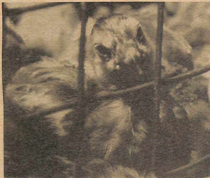
Anak2 ayam yang di-ternak di-Pusat Pertanian, Kilanas