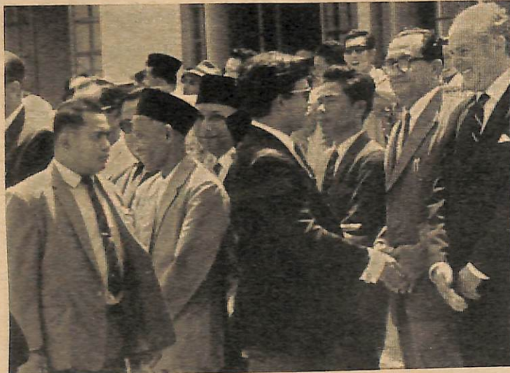
Satu pemandangan di-La- pangan Terbang Berakas pada pagi hari Rabu 7 Sep- tember, 1966 sa-belum Yang

Lukisan tersebut di-lukis dengan da'wat China berwarna hitam, menunjukkan satu pemandangan Masjid Omar Ali Saifuddin dan Kampong Ayer Brunei pada hari kabor sa-lepas hujan.