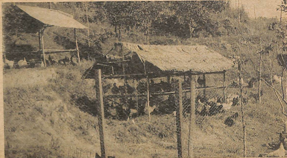
Gambar ini ia-lah chara menternak ayam yang biasa di-lakukan di-kampung2.