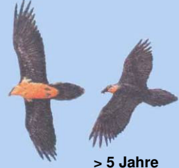
> 5 Jahre Kopf gelblich/rötlich