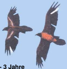
2 - 3 Jahre Markierungsreste u. Lücken