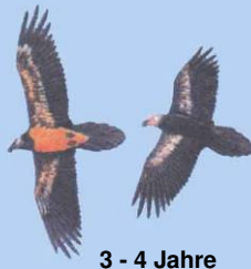
3 - 4 Jahre Kopf noch dunkel