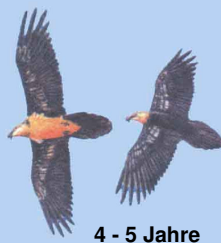
4 - 5 Jahre helle Kopffärbung