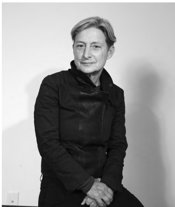
Judith Butler