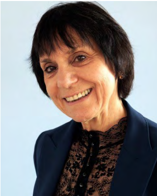
Monique David Ménard © Institut for Cultural Inquiry, Berlin

Elle a récemment publié La vie sociale des choses, l'animisme et les objets (Éditions Le Bord de l'eau, 2020) et, avec Beatriz Santos, Pulsions de mort. Destruction et créations (Éditions, Hermann 2023).