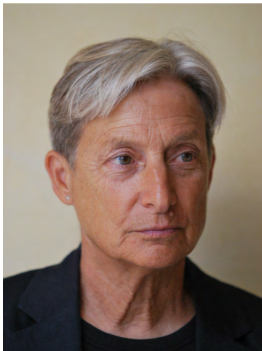
Judith Butler

Judith Butler , personnalité majeure de la pensée contemporaine internationale, est philosophe et vit aux États-Unis. Enseignant à Berkeley depuis de nombreuses années, Judith Butler a développé une réflexion philosophique originale, à partir d'un dialogue critique avec plusieurs figures majeures de la pensée française des années 1940 aux années 1980, parmi lesquelles Simone de Beauvoir, Michel Foucault, Louis Althusser, Jacques Derrida, Jacques Lacan, ou encore Monique Wittig. Figure de proue de la théorie queer et des « gender studies », Judith Butler publie en 1990 aux États-Unis Trouble dans le genre . Dans ce livre mondialement reconnu et publié en France en 2005, Butler développe la théorie de la « performativité du genre », qui a constitué un apport essentiel dans le champ des études féministes.