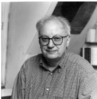
Etienne Balibar

Philosophe, Étienne Balibar est ancien professeur à l'Université de Paris-Nanterre, et enseignant invité à l'Université Columbia de New-York et à l'université Kingston de Londres. Ses intérêts principaux concernent la théorie politique, l'épistémologie des sciences sociales, l'anthropologie philosophique. En 2017, il reçoit le Prix Hannah Arendt pour la pensée politique, décerné par la Ville de Brême et la Fondation Heinrich Böll. Parmi ses ouvrages figurent l'émblématique Lire le capital , co-écrit avec Louis Althusser, Pierre Macherey, Jacques Rancière, Roger Establet, paru en 1965, ainsi que plus récemment Citoyen sujet et autres essais d'anthropologie philosophique (Presses Universitaires de France, 2011). Étienne Balibar fait partie des figures qui ont introduit la pensée de Judith Butler en France.