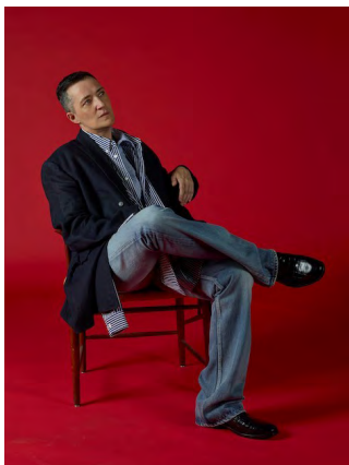
Paul B. Preciado

Récemment, il a réalisé le film Orlando : ma biographie politique , inspiré du roman Orlando de Virginia Woolf. Le film a reçu le prix spécial du jury dans la section Encounters à la Berlinale 2023 et le Teddy Award du meilleur documentaire.