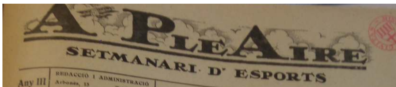
Autor: Aleix Solernou Puig Estudi supervisat per: Josep Maria Figueres