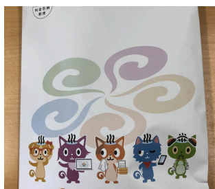
参加者全員に「お楽しみ袋」を配布