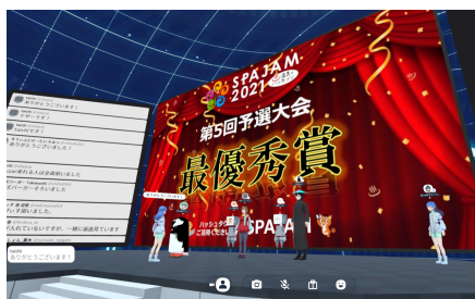
VR空間等のITツール等を活用

新型コロナウイルス感染防止の観点からリアルハッカソンを開催することが困難な状況となっておりましたが、このような危機的な状況をポジティブに捉えて、ビデオ会議やチャットツール等のITツールを活用したオンラインハッカソンのフォーマットを開発しました。