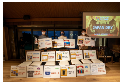
本選では豪華賞品を提供