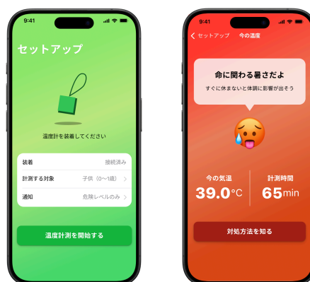
開発アプリ「あついよアラート」