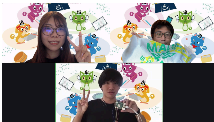
最優秀賞チーム「チームなべ太郎」

温度計の開発にはRaspberry Piを使用しており、審査員全員が「欲しい！」と感じるほどのインパクトを与えた。このアイデアは特に暑さへの対応が求められる場面で非常に役立つと評価され、最優秀賞を受賞した。