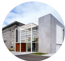
Teach Cúirte Thulach Mhór

Bíonn an chúirt seo ag déileáil la cásanna atá níos tromchúisí ná na cásanna a bhíonn os comhair na Cúirte Dúiche. Tá 43 breitheamh ar an gcúirt seo agus bíonn siad ag plé le cásanna sibhialta agus coiriúla.