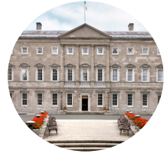
Tithe an Oireachtais suite i dTeach Laighean

Muna bhfuil Teachta Dála mar bhall de pháirtí polaitíochta Rialtais, deirtear go bhfuil said ‘sa bhFreasúra’ agus bíonn an fhreagracht orthu súil a choinneáil ar chinntí an Rialtais. Bíonn an rogha ag gach Teachta Dála vóta a chaitheamh ar son nó i gcoinne Billí nua.