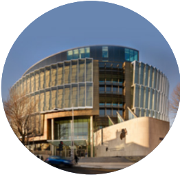
Na Cúirteanna Breithiúnais Coiriúla

Tá cúig chúirt éagsúil i gcóras cúirteanna na hÉireann. Tugtar cásanna sibhialta agus cásanna coiriúla os comhair cúirteanna éagsúla, ag braith ar an gcás.