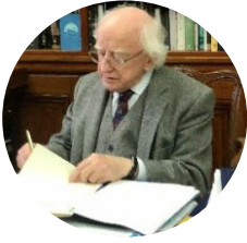
Uachtarán na hÉireann, Michael D. Higgins