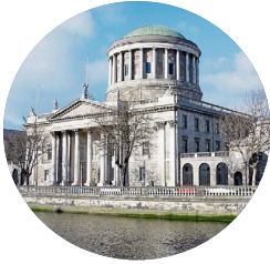
Na Ceithre Cúirteanna

Tá rannóg ar leith den Ard-Chúirt ann darb ainm an Chúirt Tráchtála. Le cas a thabhairt os comhair na cúirte seo, caithfidh comhlachtaí léiriú gur fiú os cionn €1,000,000 an aighneas atá idir na páirtithe!