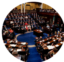
Dlíthe nua a dhréachtú