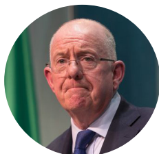
Charlie Flanagan An tAire Dlí agus Cirt

Seo iad príomhghnéithe an chóras dlí agus cirt in Éirinn, agus tá ardmheas ar chóras dlí agus cirt na hÉireann ar fud an domhain. Caithfidh córas maith dlí agus cirt a bheith cóir agus cothrom do gach duine agus cearta na ndaoine a chosaint. Is é Charlie Flanagan an tAire Dlí agus Cirt faoi láthair.