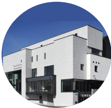
Teach Cúirte Chill Chainnigh