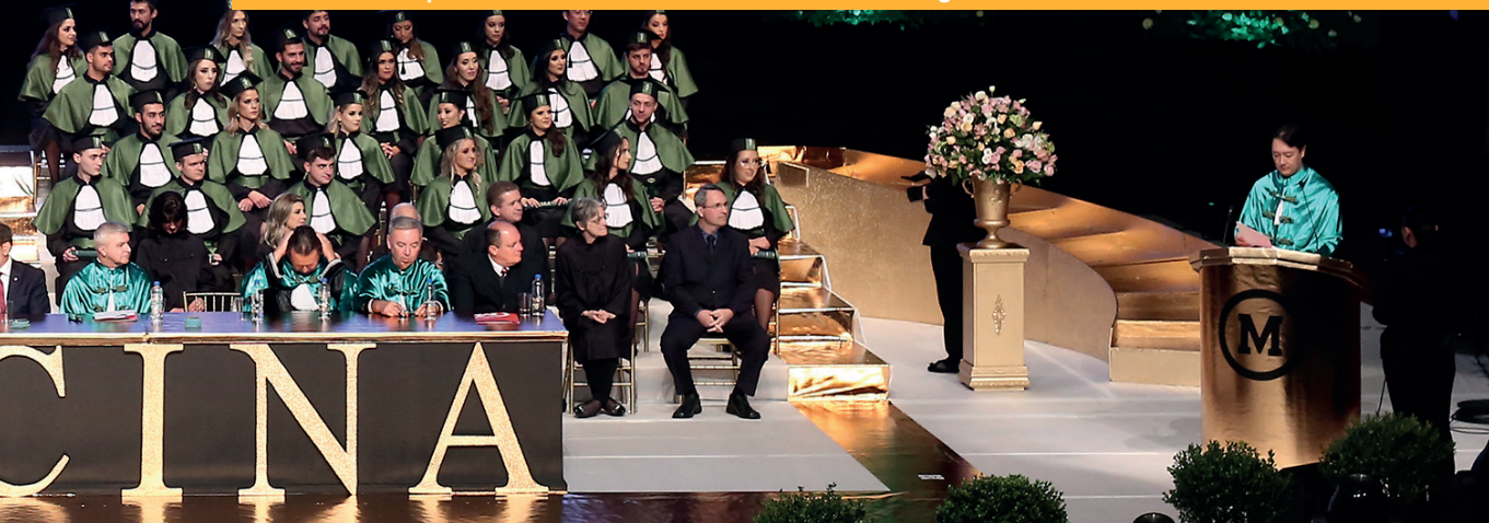
Formatura da primeira turma de Medicina da Faculdade Evangélica Mackenzie do Paraná

Portanto, um código de ética está, por sua própria natureza, vinculado a absolutos, por meio dos quais as atitudes e decisões em seu campo de aplicação, devem ser avaliadas ou julgadas e, assim, consideradas meritórias ou dignas de reprovação.