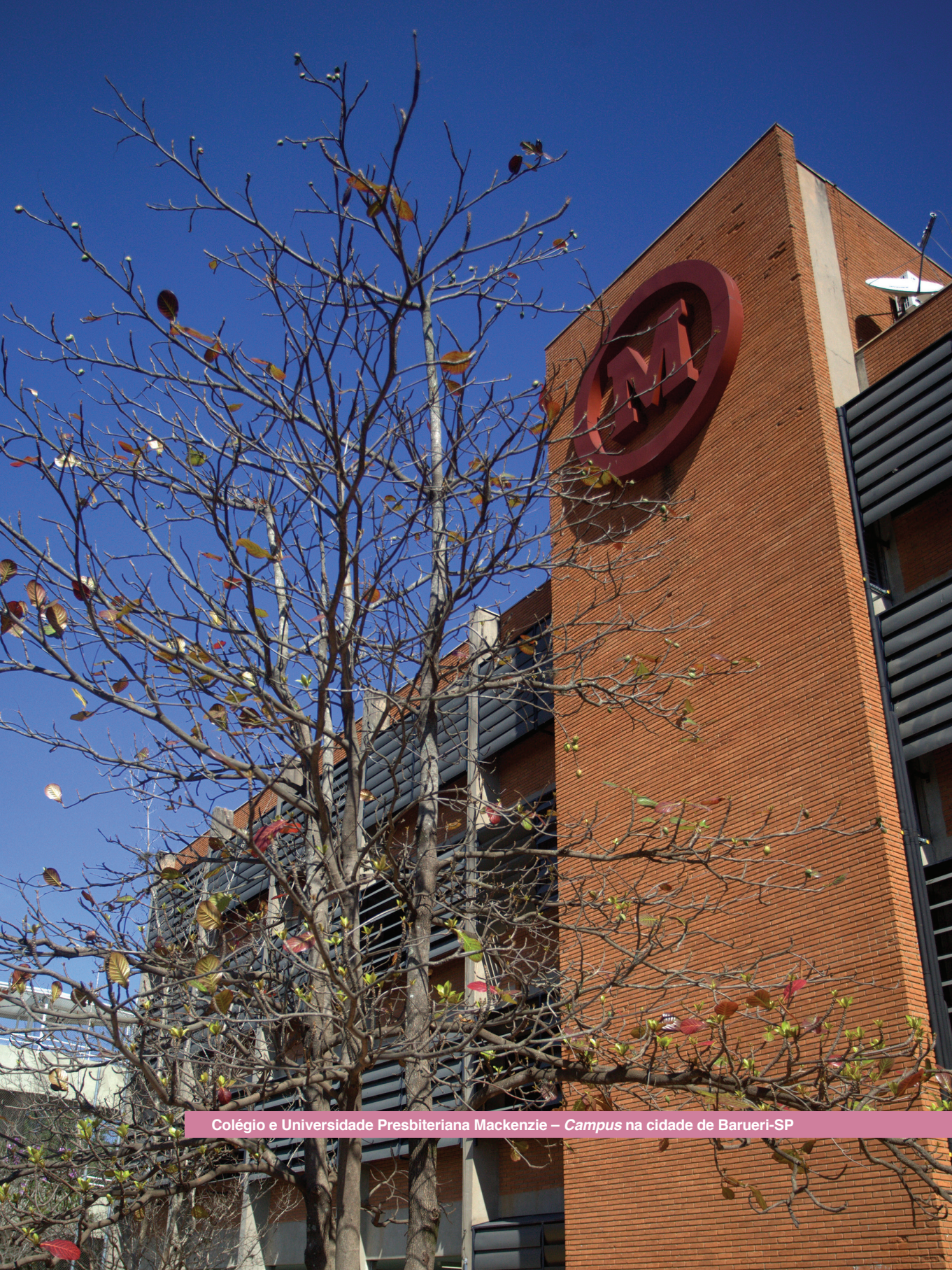
Colégio e Universidade Presbiteriana Mackenzie – Campus na cidade de Barueri-SP