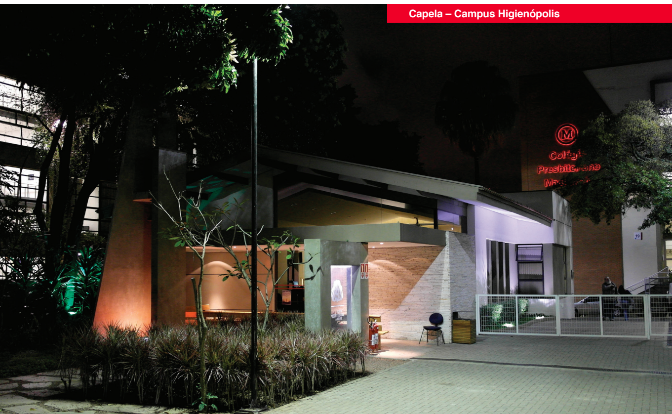
Capela – Campus Higienópolis

Para que cada colaborador tenha clareza sobre seu próprio papel no cumprimento dessa MISSÃO e o foco na VISÃO Institucional do Mackenzie, é essencial elucidar a acepção das expressões que compõem este Código de Ética.