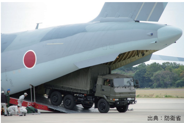
図2 トラック車両の自走搭載 Fig. 2 Driving a truck into the aircraft

コックピット風防・主翼外翼（全体の半分）・水平尾翼などの機体構造や、統合表示機・慣性航法装置・飛行制御計算機・補助動力装置APU・衝突防止灯・脚揚降システムコントロールユニットなどの装備品を共通・共用化しており、機体重量比で約25%が共通部品、搭載システムでは品目数で約75%が共通の装備となっている（図4）。