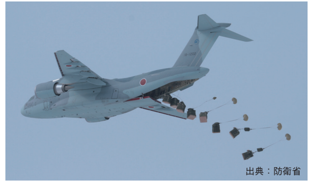
図3 空中投下状況 Fig. 3 Air drop