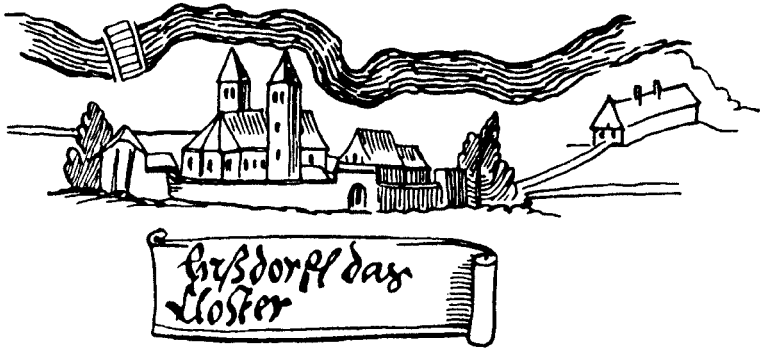
Ansicht des Klosters aus dem 16. Jahrhundert