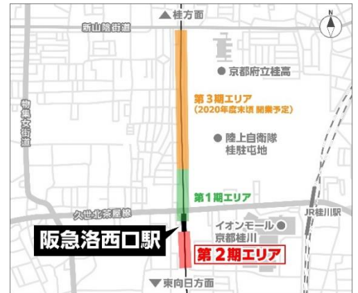
トート 「TauT阪急洛西口」開発エリアの位置図