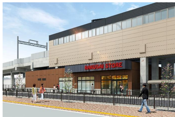
第2期エリアの外観イメージ

阪急電鉄は、「 トート TauT 阪急洛西口」の第2期エリア（洛西口駅南側・東向日駅方面）を2020年1月29日（水）に開業することを決定しましたので、お知らせします。