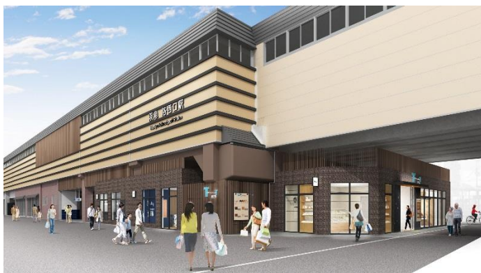
洛西口駅東側から見た施設の外観イメージ