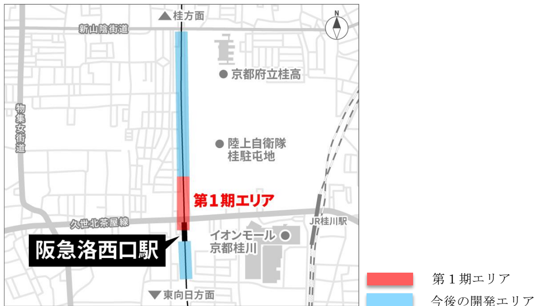
「TauT阪急洛西口」開発エリアの位置図