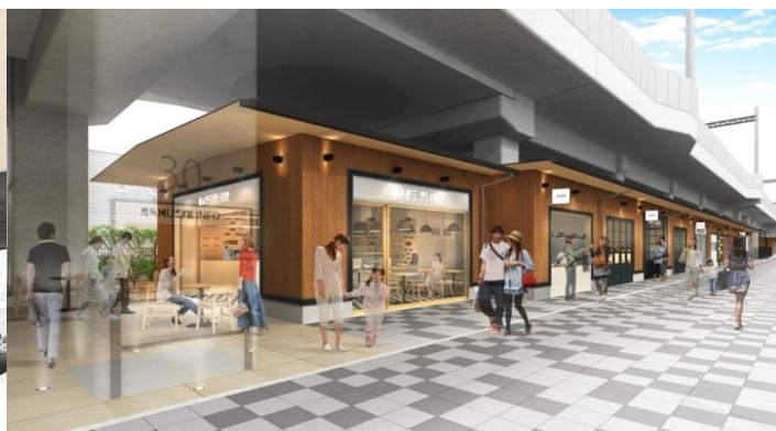
洛西口駅(桂駅方面)の東側歩道から見た施設の外観イメージ

阪急電鉄では、京都市とともに開発を進めている阪急京都線・洛西口～桂駅間の高架下エリア「 トート TauT 阪急洛西口」について、先行開業する第1期エリア(洛西口駅付近)のグランドオープンが2018年10月22日(月)に決定しましたので、お知らせします。