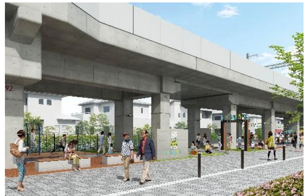
第3期エリアの外観イメージ

阪急電鉄では、京都市と連携しながら開発を進めている「TauT 阪急洛西口」の第3期エリアのオープン日を2月1日（月）に決定しましたので、お知らせします。