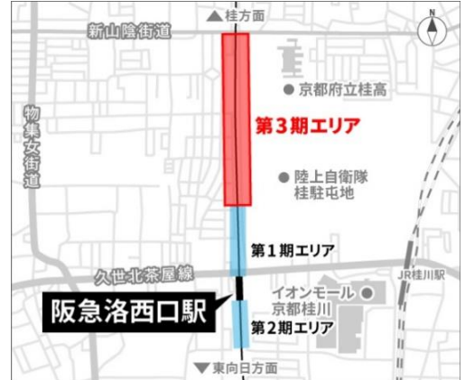
「TauT 阪急洛西口」開発エリアの位置図