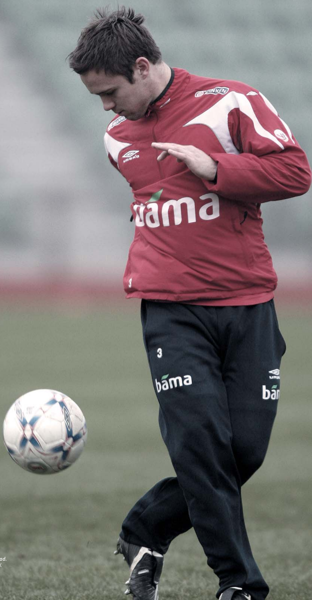
Landslagsspiller Kristofer Hæstad.