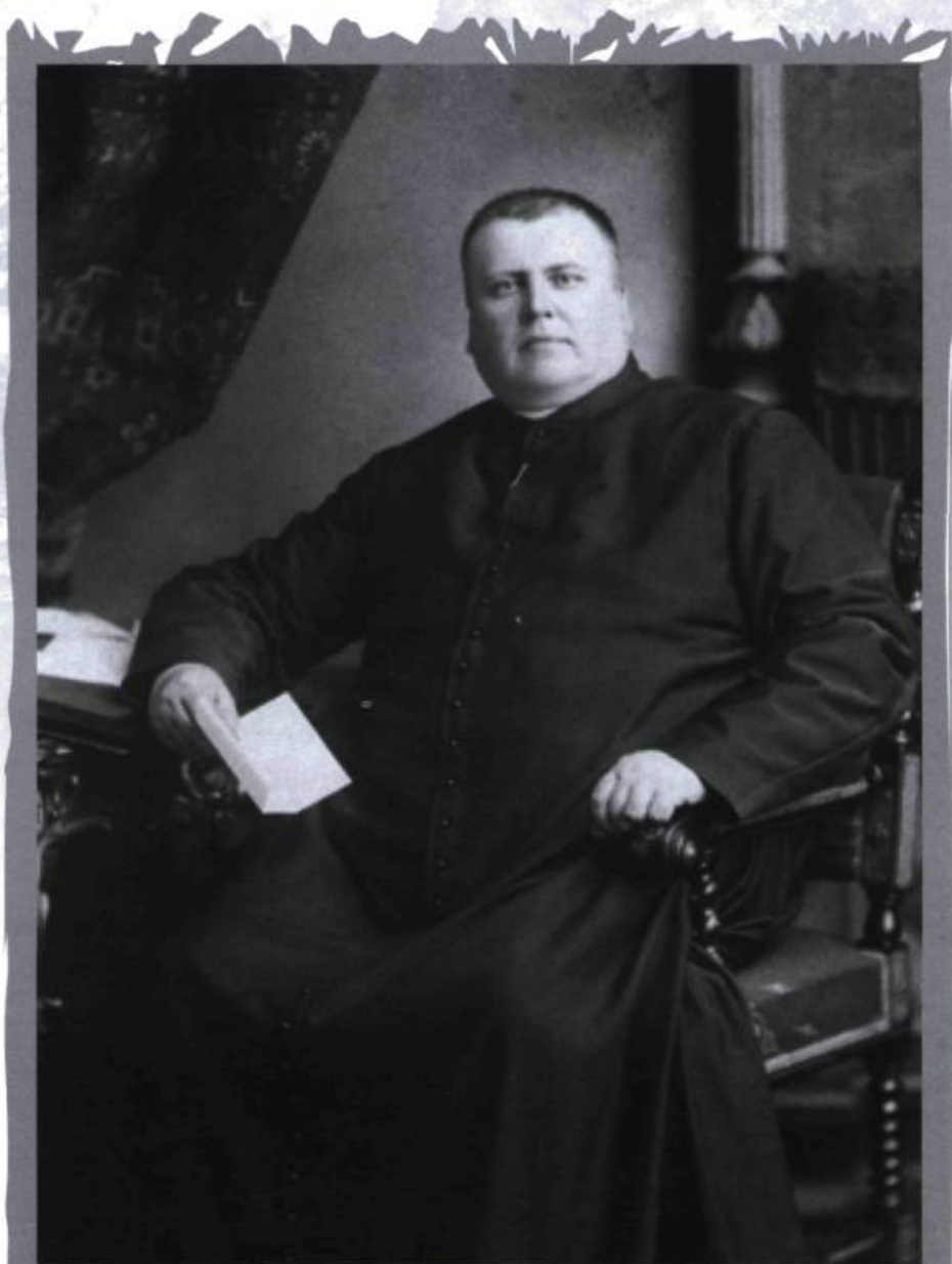
Photographie du curé Labelle.

Après avoir été vicaire des paroisses Sault-au-Récollet et Saint-Jacques-le-Mineur, il obtient sa première cure à la nouvelle paroisse de Saint-Antoine-Abbé, dans le comté de Huntingdon, où ses parents viennent le rejoindre pour habiter avec lui. Cependant, son père décède le 31 décembre 1861. Lorsqu'il est nommé curé de Saint-Bernard-de-Lacolle le 7 février 1863, sa mère, devenue veuve, l'y accompagne. C'est le 15 mai 1868 qu'il devient curé de Saint-Jérôme.