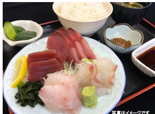
おすすめメニュー「刺身定食」(1,080円)

当店は、海から近い立地にあり、海の幸に恵まれた食事を味わっていただけます。おすすめメニューの「刺身定食」は、常磐沖で捕れた新鮮な旬の刺身をお楽しみいただけるメニューです。また、厳選した地域のお土産品を取り揃え、お客さまのお越しをお待ちしております。