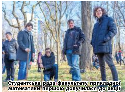
Студентська рада факультету прикладної математики першою долучилася до акції