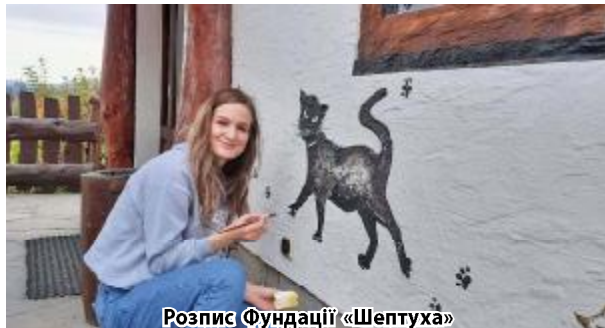
Розпис Фундації «Шептуха»

Студентки ДНУ разом з викладачами створили роз-