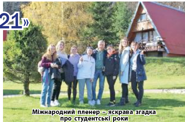
Міжнародний пленер – яскрава згадка про студентські роки

пис стіни відповідно до стилістичної візуалізації закладу, зобразивши котів у рослинному середовищі. Наприкінці пленеру «Бецади – 2021» наші мисткині