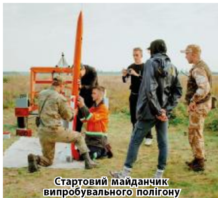
Стартовий майданчик випробувального полігону

Мабуть, усі технічні університети мріють про таку навчально-виробничу базу, але вона є тільки в ДНУ.