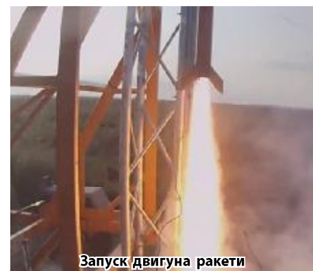
Запуск двигуна ракети

Ми звикли пишатися причетністю фізико-технічного й інших факультетів