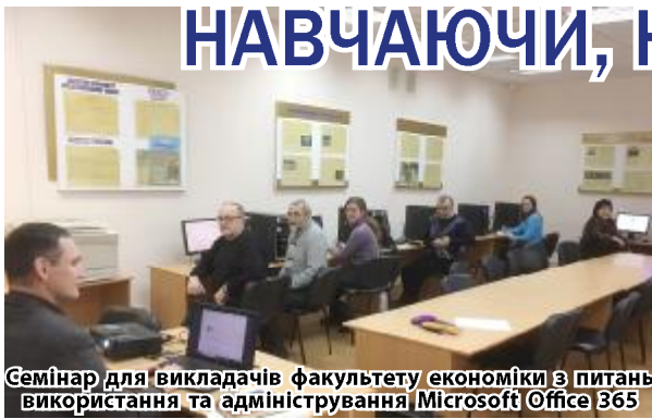
Семінар для викладачів факультету економіки з питань використання та адміністрування Microsoft Office 365

Крім того, педагогічні та науково-педагогічні працівники можуть із власної ініціативи додатково проходити підвищення кваліфікації за іншими напрямками, такими як психолого-фізіологічні особливості здобувачів освіти певно-