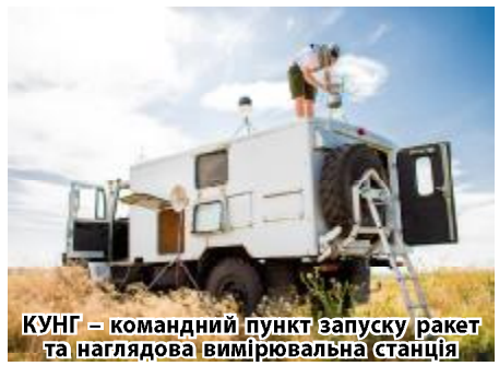
КУНГ – командний пункт запуску ракет та наглядова вимірювальна станція