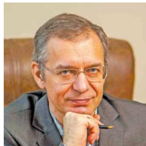
Доктор хімічних наук, професор, заслужений діяч науки та техніки України