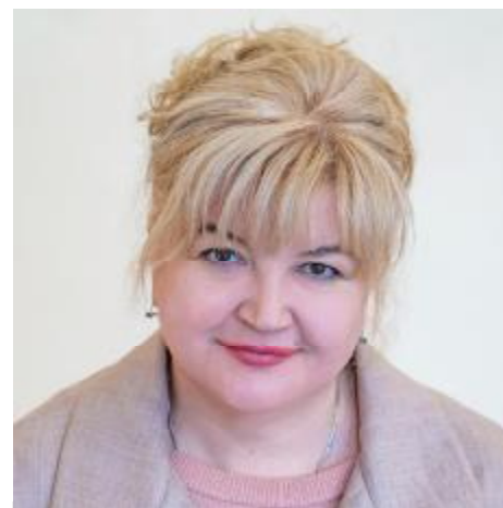
Докторка юридичних наук, професорка, деканеса юридичного факультету