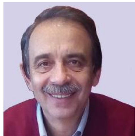
Доктор технічних наук, професор, лауреат Державної премії України в галузі освіти