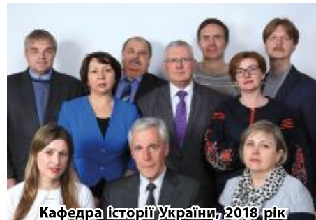
Кафедра історії України, 2018 рік