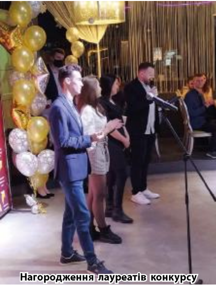
Нагородження лауреатів конкурсу