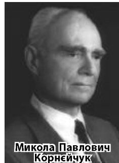
Микола Павлович Корнейчук

Одним із важливих напрямів теорії наближень є апроксимація з обмеженнями. Саме дніпровські математики отримали в цьому напрямі фундаментальні результати, захистили низку дисертацій, опублікували монографії. Не звикати потужним фахівцям долати складнощі, здобувати перемоги, а потім ділитися з колегами результатами, але цього року науковців спіткали ще й обмеження карантинні... Проте попри всі негаразди традиційна міжнародна конференція Approximation Theory and its Applications відбулася. Вона пройшла в новому, незвичному для нас дистанційному форматі на платформі Zoom, але це жодним чином не зменшило вагомості події. Адже цього разу форум був присвячений 100-річчю з дня народження нашого вчителя, вчителя наших учителів, лауреата Державної премії СРСР, Державної премії України в галузі на-