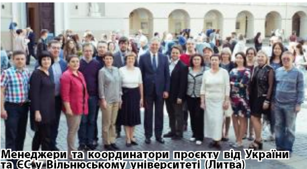
Менеджери та координатори проєкту від України та ЄС у Вільнюському університеті (Литва)

У жовтні за участі ДНУ успішно завершений масштабний проєкт DocHub у рамках програми Еразмус+ K2 «Розбудова інституційної спроможності вищої освіти у країнах-партнерах Європейського Союзу». Повна назва проєкту – «Структурування співпраці у докторських дослідженнях, навчаннях універсальних навичок та академічного письма у регіонах України».