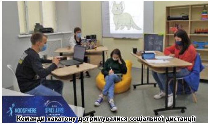
Команди хакатону дотримувалися соціальної дистанції

Окрім традиційних Дніпра, Києва, Кам'янського, Запоріжжя, Харкова, у хакатоні на локації Dnipro взяли участь ентузіасти вивчення космосу з Рівного, Миколаєва, Волновахи, Краматорська. Усього учасники презентували 16 проєктів. Цього року до кон-