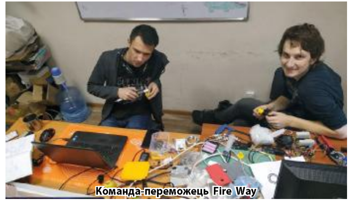
Команда-переможець Fire Way