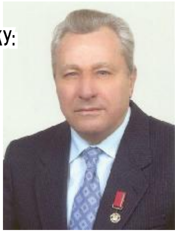
так гострий розум веселять розмови краснослівні.

То божжа іскра так зорить – нема замріям спину. Твори і гідних вчи творить, хто явить нам заміну.