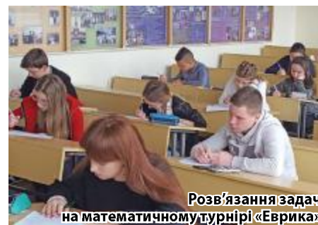
Розв'язання задач на математичному турнірі «Еврика»