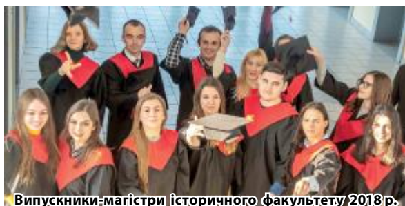
Випускники-магістри історичного факультету 2018 р.

Щороку Дніпровський національний університет імені Олеся Гончара посідає високі місця в освітніх рейтингах, таких як: національні академічні рейтинги «Освіта.ua» та «ТОП-200 Україна», міжнародні рейтинги Scopus , Webometrics та інші.