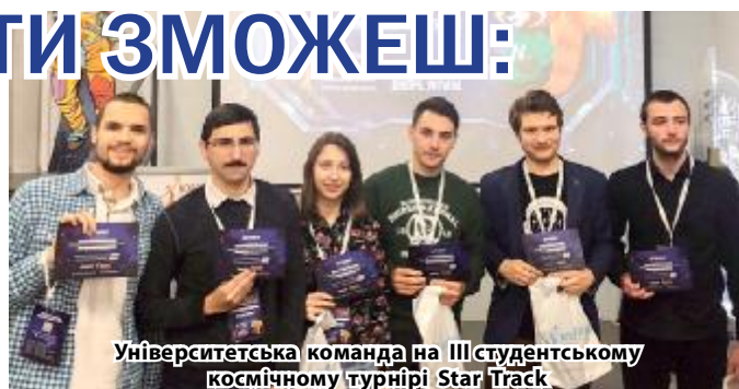
Університетська команда на III студентському космічному турнірі Star Track

❖ Отримати кваліфіковану підтримку юристів і психологів. Безоплатну допомогу надають фахівці Юри-