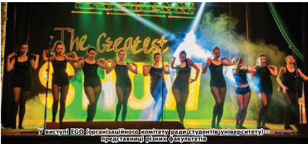
У виступі EGO (організаційного комітету ради студентів університету) – представниці різних факультетів

Найочікуваніша подія студентської осені відбулась! 21 листопада у Палаці студентів пройшов Кубок ректора-2018. 14 факультетів, більше 300 учасників, двоє ведучих, 30 організаторів, оператори Gonchar TV – усі трудилися над створенням святкової атмосфери для цього неймовірного шоу. Світло, камера, мотор!