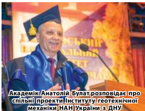
Академік Анатолій Булат розповідає про спільні проекти Інституту геотехнічної механіки НАН України з ДНУ

Член-кореспондент НАН України, директор Інституту технічної механіки НАН України і Державного космічного агентства України, лауреат Державної премії України в галузі науки і техніки, доктор технічних наук, професор Олег Пилипен-