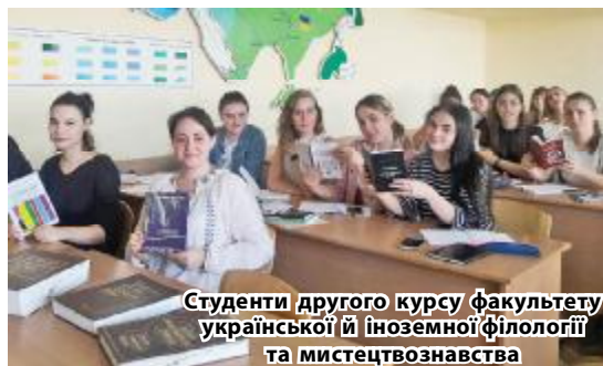
Студенти другого курсу факультету української й іноземної філології та мистецтвознавства

Розроблення словників є одним із пріоритетних напрямів науково-дослідницької діяльності Центру історії та розвитку української мови Дніпровського національного університету імені Олеся Гончара. Потреба в укладанні низки лексикографічних праць постала як наслідок спілкування мовознавців із громадянами й державними установами регіону в галузі офіційного оформлення особових документів. Зокрема, на допомогу широкому загалу спеціалістів і громадян, які з різних причин змушені встановлювати відповідники між одними й тими самими прізвищами, іменами по батькові, орфографічно закріпле-