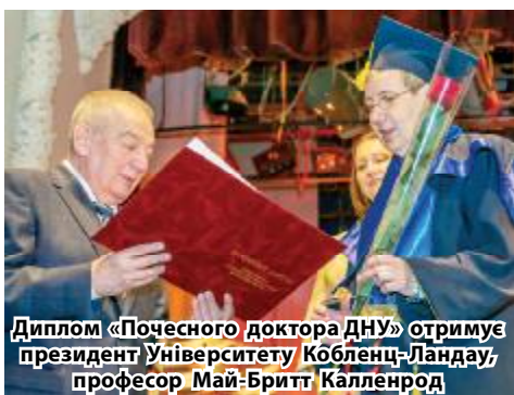
Диплом «Почесного доктора ДНУ» отримує президент Університету Кобленц-Ландау, професор Май-Бритт Калленрод

Відомий німецький фізик, президент Університету Кобленц-Ландау, професор Май-Бритт Калленрод, до речі, перша і єдина жінка серед Почесних докторів нашого університету, розповіла про співробітництво між ДНУ та Університетом Кобленц-Ландау, в рамках якого реалізовано чотири TEMPUS-проекти, уже 60 студентів нашого університету пройшли навчання та стажування в німецькому виші. Розпочато співробітництво в галузі академічних обмінів за програмою Erasmus+, що реалізується та фінансується за підтримки Європейського Союзу. У серпні між університетами підписана додаткова угода, яка надає можливість нашим студентам навчатися за Програмою надання двох дипломів.