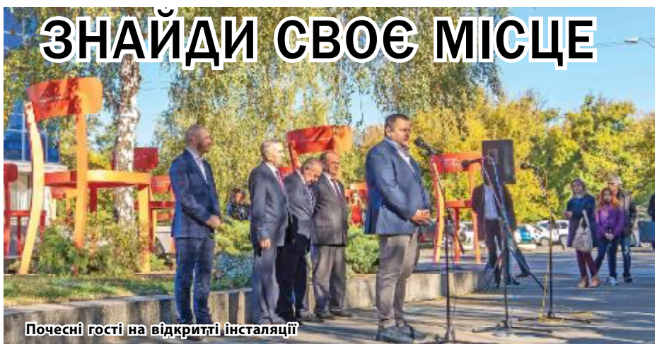
Почесні гості на відкритті інсталяції

Власне «місце під сонцем» тепер можна знайти біля головного корпусу ДНУ: незвичайна інсталяція з 17 червоних стільців відкрита до 100-літнього ювілею університету. Стільці не прості, як і будь-яка сучасна інсталяція, мають певний концепт і сенс.