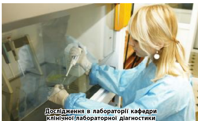
Дослідження в лабораторії кафедри клінічної лабораторної діагностики

Крім того, було проведено безкоштовне лабораторне обстеження, за яким визначали показники загального аналізу крові та загального аналізу сечі, рівнів глюкози та холестерину крові. Загалом лаборанти обстежили 58 осіб. Усі бажачі змогли перевірити власне здоров'я – здати певні аналізи та отримати консультації фахівців. Як бачимо, чимало звернень було з приводу хвороб органів травлення. Дійсно, це