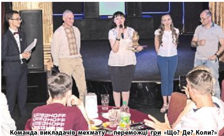
Команда викладачів мехмату – переможці гри «Що? Де? Коли?»

Це був новий, за словами студентів, мегакрутий experience для нашого факультету, організаторів свята, ради студентів та всіх учасників.