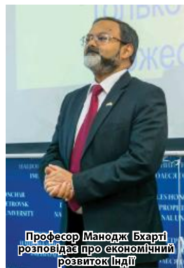
Професор Манодж Бхарті розповідає про економічний розвиток Індії

Для майбутніх українських економістів і дипломатів Манодж Кумар Бхарті на конкретних прикладах окреслив, як саме наша країна може використати потенціал Індії. Зокрема, одним із напрямів співп-