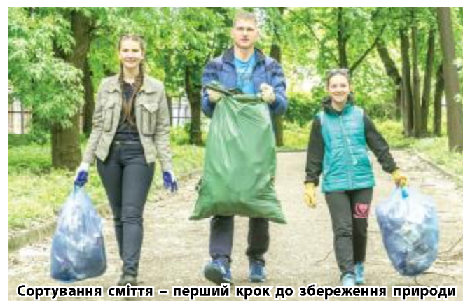
Сортування сміття – перший крок до збереження природи

Факультет міжнародної економіки влаштував суботник у парку поруч з головним корпусом університету на проспекті Гагаріна. Організатори запропонували кожному, хто цінує красу і чистоту навколо себе, облаштувати власними зусиллями порядок і гармонію. Інформацію про запланований захід поширили через соцмережі. У результаті, до прибирання активно й добровільно долучилися окрім студентів і викладачів факультету міжнародної економіки, представники історичного, юридичного, біолого-екологічного факультетів та факультету медичних технологій діагностики та реабілітації.