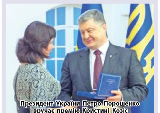
Президент України Петро Порошенко вручає премію Крістині Козіс

Кристина Козіс вирішила актуальну науково-технічну проблему оцінки якості ракетно-космічної техніки на прикладі багатьох зварних з'єднань міжступеневого відсіку ракети-носія та корпусів ракетних двигунів твердого палива, використовуючи методи моделювання, математичної статистики та теорії оцінювання. Особливість її роботи – в унікальності самих об'єктів ракетно-космічної техніки, оскільки вони розробляються вперше, мають сучасні конструкторсько-технологічні рішення їх створення, та, як правило, не мають відомих аналогів, відповідно, й