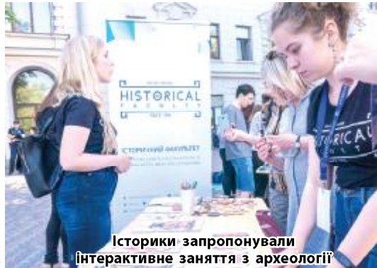
Історики запропонували інтерактивне заняття з археології

вправу «Герб сім'ї», яка допомагає у діагностиці внутрішньо-сімейних відносин, і майстер-клас із фітнес-вєслування на унікальному тренажері Concept2. «Concept2 – єдиний у світі вєслувальний тренажер, оснащений електронним та-