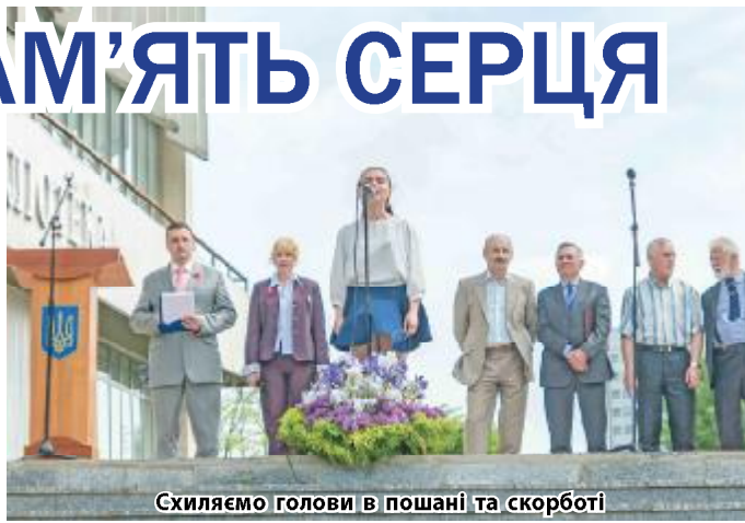
Схилиємо голови в пошані та скорботі

У День пам'яті та примирення в університеті відбувся мітинг-реквієм. Педагоги, студенти і родичі учасників Другої світової війни зібралися біля меморіалу, встановленого поряд з науковою бібліотекою імені Олеса Гончара, щоб вшанувати пам'ять героїв і великий подвиг нашого народу в найстрашнішій війсьній катастрофі в історії людства.