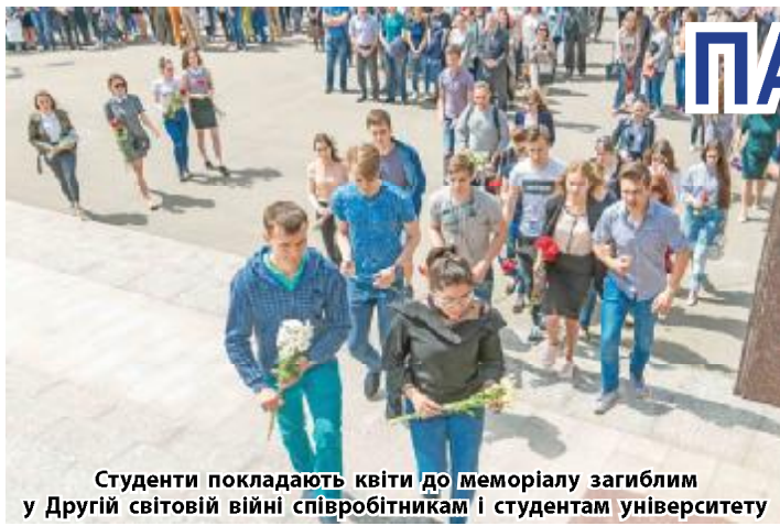
Студенти покладають квіти до меморіалу загиблим у Другій світової війни співробітникам і студентам університету

Україна вже втретє на державному рівні відзначає День пам'яті та примирення саме в день капітуляції нацистської Німеччини – 8 травня, приєднавшись до загальноєвропейської традиції пошанування учасників і жертв Другої світової війни. Долучився до патріотичної події й наш університет, який у 1941-1945 роках зробив свій внесок у перемогу над нацизмом у Європі. На полях битв полягло 160 співробітників та студентів університету. Ми разом з усім світом схилиємо голови в пошані та скорботі за полеглими у ті страшні роки.