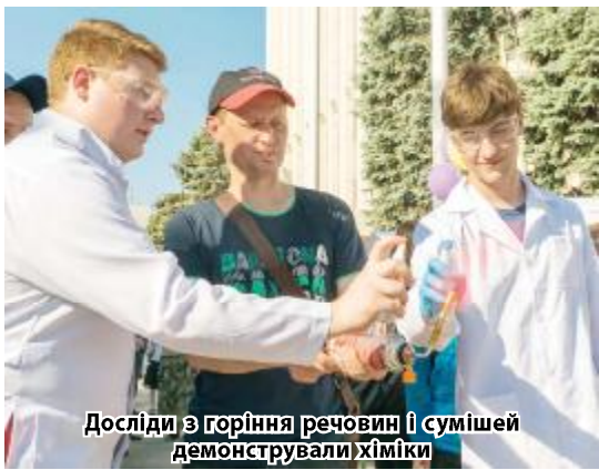
Досліди з горіння речовин і сумішей демонстрували хіміки

У Дніпрі вдруге відбувся науково-популярний фестиваль «Ніч науки». Дніпровський національний університет представляли п'ять факультетів: хімічний, історичний, економічний, міжнародної економіки, медичних технологій діагностики та реабілітації, а також Коледж ракетно-космічного машинобудування.