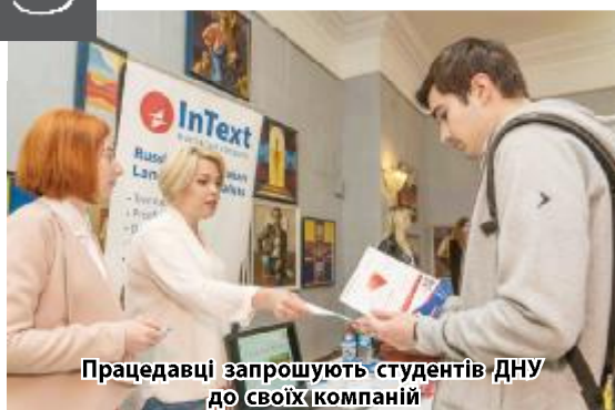
Працівці запрошують студентів ДНУ до своїх компаній

У Палаці студентів ДНУ зібралися більше 40 місцевих закладів, підприємств, молодіжних організацій, а також представників європейських міжнародних компаній для презентації власної діяльності, продукції та кар'єрних можливостей. Студенти активно спілкувалися з представниками компаній-учасниць, залишали резюме, записувалися на співбесіди і стажування, ставали учасниками безкоштовних майстер-класів із розвитку важливих професійних навичок. Зокрема, для студентської молоді підготували панельну дискусію «Україна: нові можливості для професійного розвитку сучасної молоді»