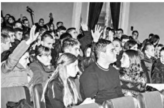
Представники студентських рад гуртожитків міста схвалюють нові ініціативи

Ректор Микола Поляков зазначив, що студентські ініціативи завжди підтримуються ректоратом і профкомом ДНУ: «Ми очікуємо, що студенти нарешті стануть повноправними господарями в гуртожитках: дбайливими, відповідальними, небайдужими».