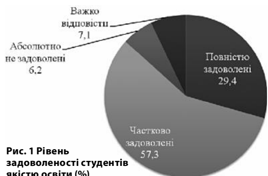
Рис. 1 Рівень задоволеності студентів якістю освіти (%)

Оцінюючи окремі аспекти освітнього процесу, переважна