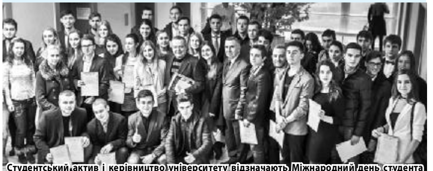
Студентський актив і керівництво університету відзначають Міжнародний день студента