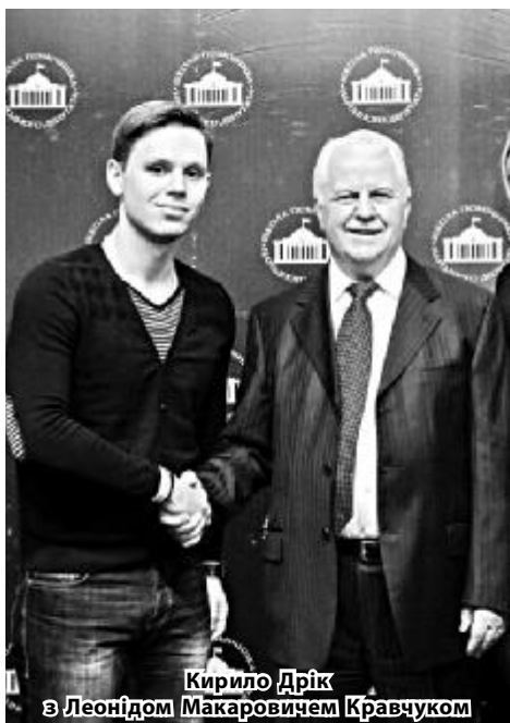
Кирило Дрік з Леонідом Макаровичем Кравчуком