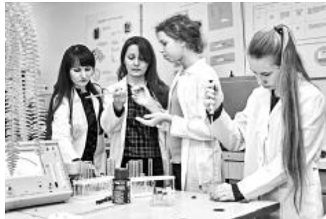
Практикум на кафедрі біофізики та біохімії

Акція для школярів старших класів стала вже традиційною на факультеті біології, екології та медицини.