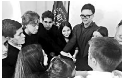
Командна робота студентів і школярів

Учні познайомилися з деканом факультету, професором Олександром Смірновим та дружим фаховим науково-педагогічним колективом кафедр факультету, представники яких презентували напрями підготовки та наукові школи. Студенти-економісти розповіли ліцеїстам про систему студентського самоврядування, організацію діяльності спортивного сектору, поділилися своїми успіхами у науковій сфері та можливостями, які надає університет щодо участі у різноманітних міжнародних та всеукраїнських наукових та громадських заходах (конференції, олімпіади, круглі столи, симпозиуми, тренінги).