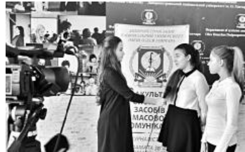
Школярі випробують телевізійні професії

Під час гри команди отримали маршрутні листи та помандрували сімома станціями, які підготували для них студенти та викладачі факультету. Виконуючи різноманітні завдання, учасники «Медіаквесту» не лише познайомилися з історією реклами від античних часів до сьогодення, принципами й особливостями газетного редагування, але й отримали можливість випробувати сучасну фото-, аудіо- і відеотехніку та виявити свої практичні здібності в якості фотографа, радіоведучого, оператора, інтерв'юера.