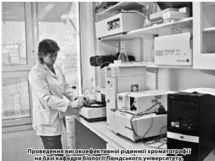
Проведення високоефективної рідинної хроматографії на базі кафедри біології Люндського університету.