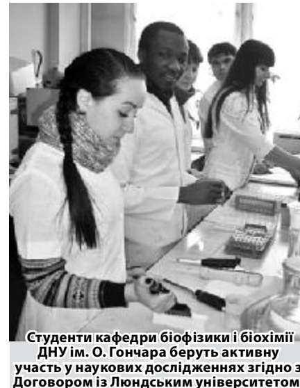
Студенти кафедри біофізики і біохімії ДНУ імені О. Гончара беруть активну участь у наукових дослідженнях згідно з Договором із Люндським університетом.