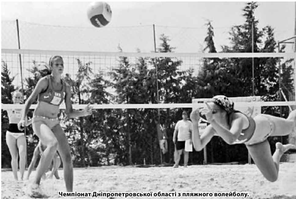
Чемпіонат Дніпропетровської області з пляжного волейболу.

Час змінює наші уявлення про зміст фізичної культури, активного дозвілля та повсякденних спортивних вправ. Це налаштовує кафедру фізичного виховання та спорту на роботу зі студентами за новими принципами знань, де провідними вимогами стають їх особисте бажання, власний вибір та індивідуальний підхід. Скорочення обов'язкових навчальних програм стимулює кафедру до розвитку секційної роботи з сучасних видів спорту, покращенню спортивно-масової роботи, залученню до загального кола спортсменів-новачків і відомих уже пе-