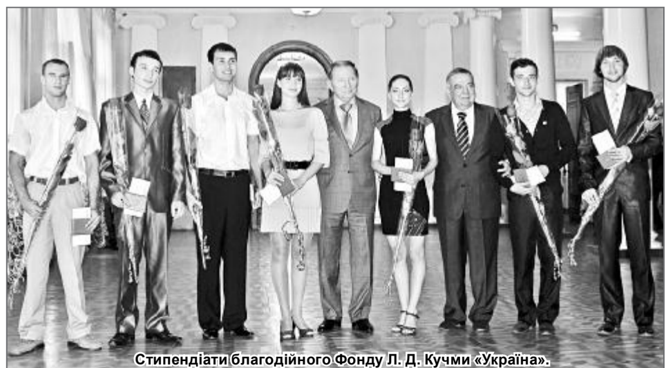
Стипендіати благодійного Фонду Л. Д. Кучми «Україна».

минають роки, але університет, який дав путівку у трудове життя, випускники не забувають: зустрічаються в Палаці культури студентів імені Юрія Гагаріна тепер уже щороку. На пам'ять про зустрічі залишаються ось такі фо-