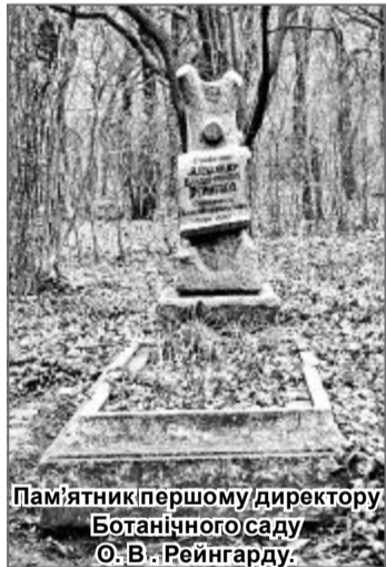
Пам'ятник першому директору Ботанічного саду О.В. Рейнгарду.

Науковці Ботанічного саду зберігають, акліматизують рослини, проводять навчальну, просвітницьку роботу з питань біології, екології, охорони природи, рослинництва, декоративного садівництва й ландшафтної архітектури.