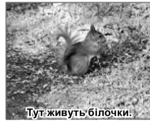
Тут живуть білочки.