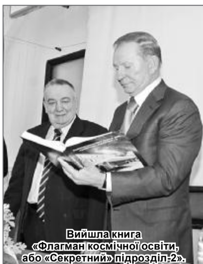
Вийшла книга «Флагман космічної освіти, або «Секретний» підрозділ-2».