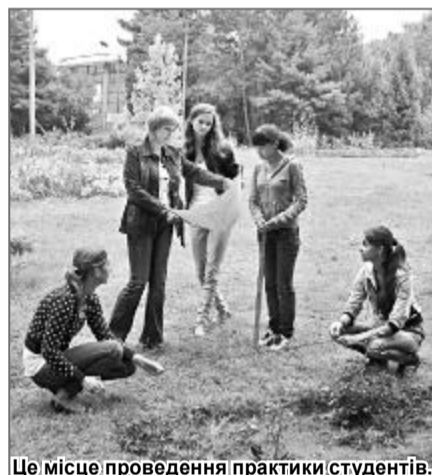
Це місце проведення практики студентів.

Науковці Ботанічного саду зберігають, акліматизують рослини, проводять навчальну, просвітницьку роботу з питань біології, екології, охорони природи, рослинництва, декоративного садівництва й ландшафтної архітектури.