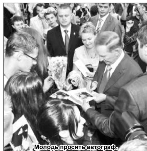
Молодь просить автограф.