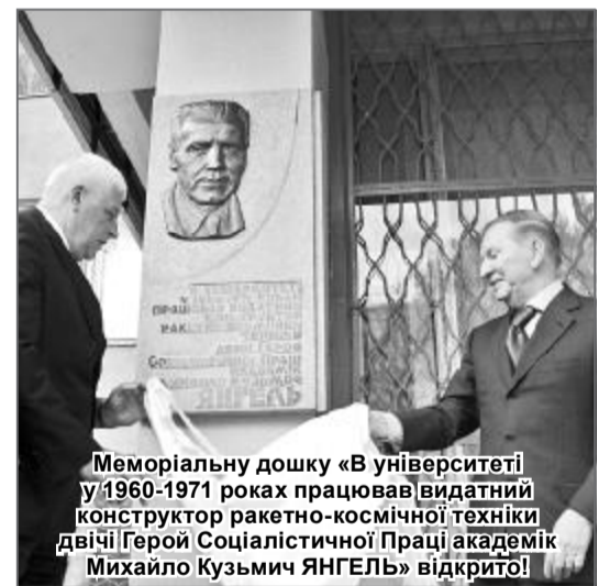
Меморіальну дошку «В університеті у 1960-1971 роках працював видатний конструктор ракетно-космічної техніки двічі Герой Соціалістичної Праці академік Михайло Кузьмич ЯНГЕЛЬ» відкрито!