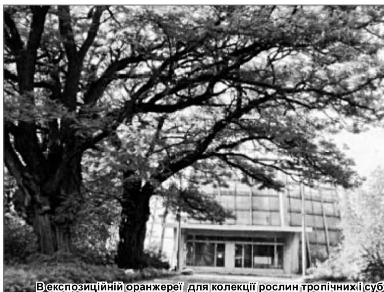
В експозиційній оранжереї для колекції рослин тропічних і субтропічних регіонів, пустель і напівпустель.