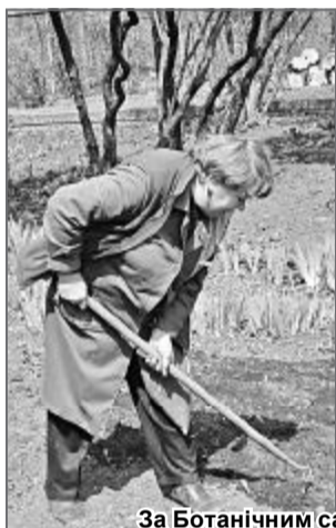
За Ботанічним садом доглядають його співробітники.

Наш сад красивий у будь-яку пору року. Особливо яскравий він улітку і восени. Осінь розфарбовує сад у жовтогарячі аж золотисті відтінки, а суворий зимовий пейзаж контрастує з яскравою тропічною зеленню експозиційної оранжереї.