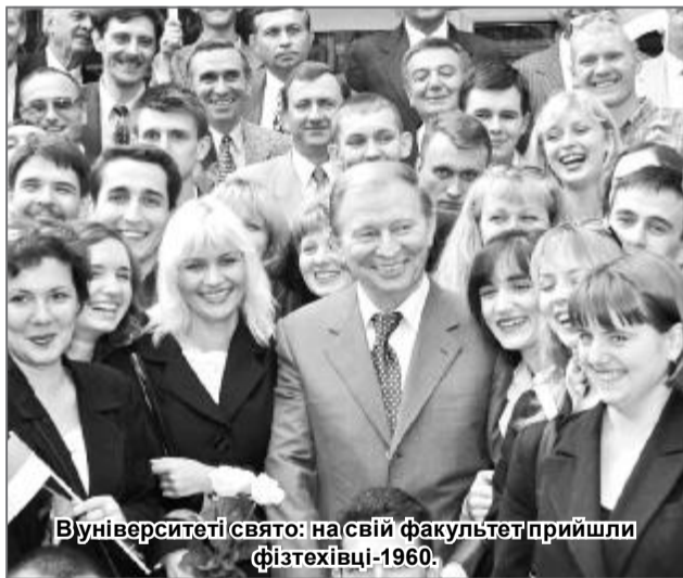
В університеті свято: на свій факультет прийшли фізтехівці-1960.

ловного корпусу, де розміщена галерея Героїв, серед 36-и портретів наших співробітників і вихованців – портрети В. Г. Команова і Героя Соціалістичної Праці В. М. Сайгака. Гордість національного університету – Президент України 1994-2005 р. Л. Д. Кучма, академік Академії космонавтики імені К. Е. Ціолковського, доктор технічних наук В. В. Вахниченко – усі, хто захистив кандидатські і докторські дисертації й викладав у закладах освіти або працював на високих постах за спеціальністю, на організації, став політиком чи самовіддано, зразково трудився на скромній посаді.