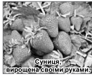
Суніця, вирощена своїми руками.